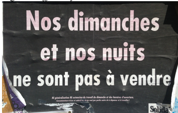
Figure 3. Affiche syndicale