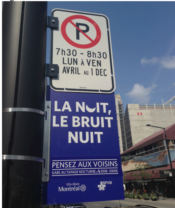
Figure 4. Gestion des conflits nocturnes à Montréal (Canada)