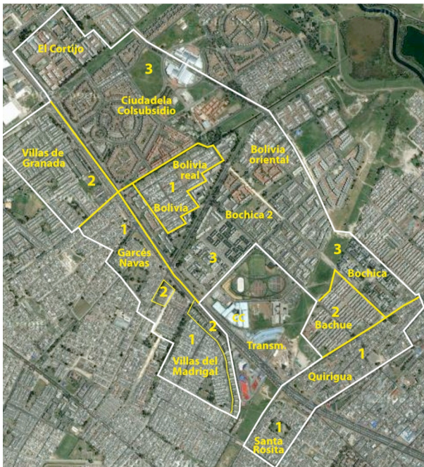
Figure 1 – Limites de la zone d'enquête Calle 80 et des strates

Réalisation : F. Dureau, sur image Google Earth