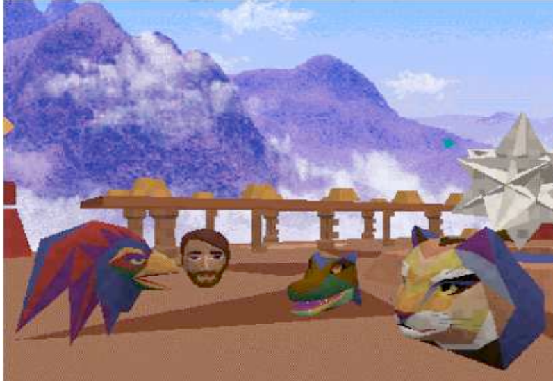
Figure 2 : l'environnement Traveler http://www.digitalspace.com/avatars/traveler.html

La comparaison avec le design de Lyceum fait apparaître la forte structuration architecturale de ce dernier, avec ses salles carrées, et ses étages rappelant ceux d'un établissement universitaire (flèche 1 sur la Figure 1), alors que le design de Traveler évoque le monde mystérieux des jeux et aventures vidéo. Autre différence majeure : l'utilisation de Traveler se fait en trois dimensions (on appuie sur les flèches de son clavier pour faire aller, venir, voler et virevolter son avatar, lui faire froncer les sourcils ou le faire sourire). Lyceum, de son côté, a une dynamique qui repose non pas sur des mouvements mais sur des changements : changements de salle, modifications en temps réel d'un texte, d'une forme ou d'une couleur, et changements de volume, de rythme et d'intonation propres à la conversation orale. Dernière différence : Traveler permet de rester anonyme (hormis la voix de l'utilisateur, qui est potentiellement identifiable) alors que Lyceum affiche en permanence le nom des connectés, et « flashe » systématiquement le nom de toute personne modifiant un état existant, comme c'est le cas pour RobinG qui dessine une bulle dans la Figure 1 (flèche 6).