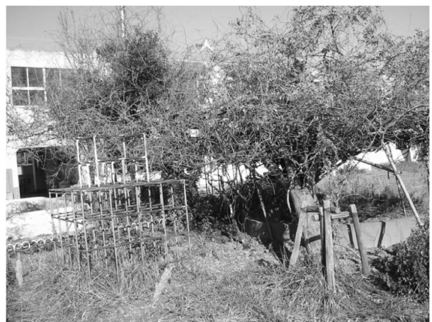
Friche urbaine à Tama

Des mesures politiques locales sont prises pour tenter d'enrayer le phénomène de rétraction. À Tama, la ville encourage la natalité et attire les familles avec enfants, par exemple en mettant des aides à domicile à disposition des femmes enceintes ou des familles avec jeunes enfants, mais selon les autorités, aucune de ces mesures n'a pour l'instant eu d'effet notable sur la tendance démographique. Des initia-