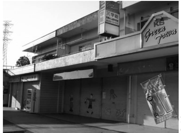
Commerces fermés à Tama

nissait pas uniquement des denrées mais participait aussi du recyclage des déchets. De nos jours, l'agriculture périurbaine peut remplir un certain nombre de fonctions écologiques : réduction sensible de la température l'été pour les secteurs résidentiels alentours, meilleure gestion des inondations en saison des pluies, amélioration de la qualité esthétique des banlieues. D'un point de vue économique, l'agriculture péri-urbaine, centrée sur une production locale et biologique de qualité, répond à une demande actuelle et peut constituer une activité lucrative. L'exemple de la banlieue agricole de Kokubunji, légèrement au nord-est de Tama, en est un bon exemple (photo 5). Cette activité agricole périurbaine pourrait répondre à la recherche de plus en plus fréquente de travail par une population retraitée mais en bonne santé, dont la situation financière nécessite la poursuite d'une activité rémunérée. D'après un questionnaire réalisé et analysé par A. Doteuchi (1998), en 1998, 25 % de la population interrogée de Tama souhaitaient continuer à travailler après l'âge de la retraite, et 38 % souhaitaient pouvoir le faire sur place. Dès lors, le rétablissement de l'agriculture périurbaine peut constituer une alternative durable dans les secteurs en rétraction.