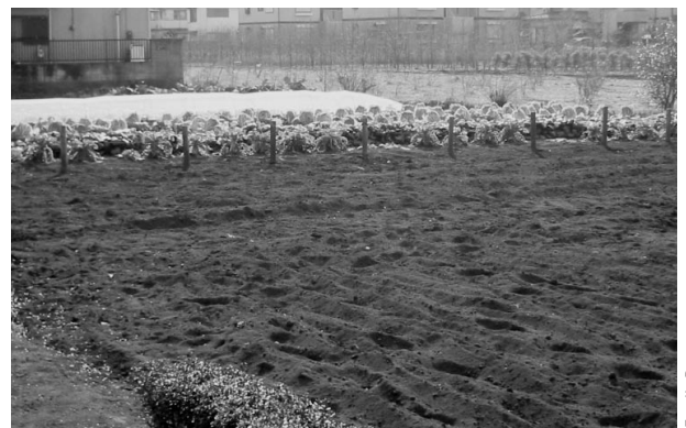
Développement de l'agriculture péri-urbaine

nissait pas uniquement des denrées mais participait aussi du recyclage des déchets. De nos jours, l'agriculture périurbaine peut remplir un certain nombre de fonctions écologiques : réduction sensible de la température l'été pour les secteurs résidentiels alentours, meilleure gestion des inondations en saison des pluies, amélioration de la qualité esthétique des banlieues. D'un point de vue économique, l'agriculture péri-urbaine, centrée sur une production locale et biologique de qualité, répond à une demande actuelle et peut constituer une activité lucrative. L'exemple de la banlieue agricole de Kokubunji, légèrement au nord-est de Tama, en est un bon exemple (photo 5). Cette activité agricole périurbaine pourrait répondre à la recherche de plus en plus fréquente de travail par une population retraitée mais en bonne santé, dont la situation financière nécessite la poursuite d'une activité rémunérée. D'après un questionnaire réalisé et analysé par A. Doteuchi (1998), en 1998, 25 % de la population interrogée de Tama souhaitaient continuer à travailler après l'âge de la retraite, et 38 % souhaitaient pouvoir le faire sur place. Dès lors, le rétablissement de l'agriculture périurbaine peut constituer une alternative durable dans les secteurs en rétraction.