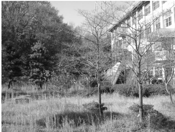
Ecole désaffectée à Tama