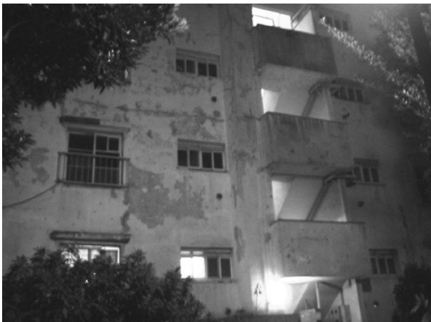
Un immeuble vide à Tama

Force est de constater que les opérations d'aménagement prennent peu en compte la rétraction émergente de certains