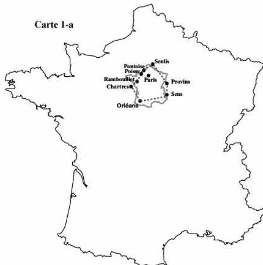
Figure 1. La vision d'un monde-point: la "carte de l'imaginaire" de Constantin Pecqueur (1839)