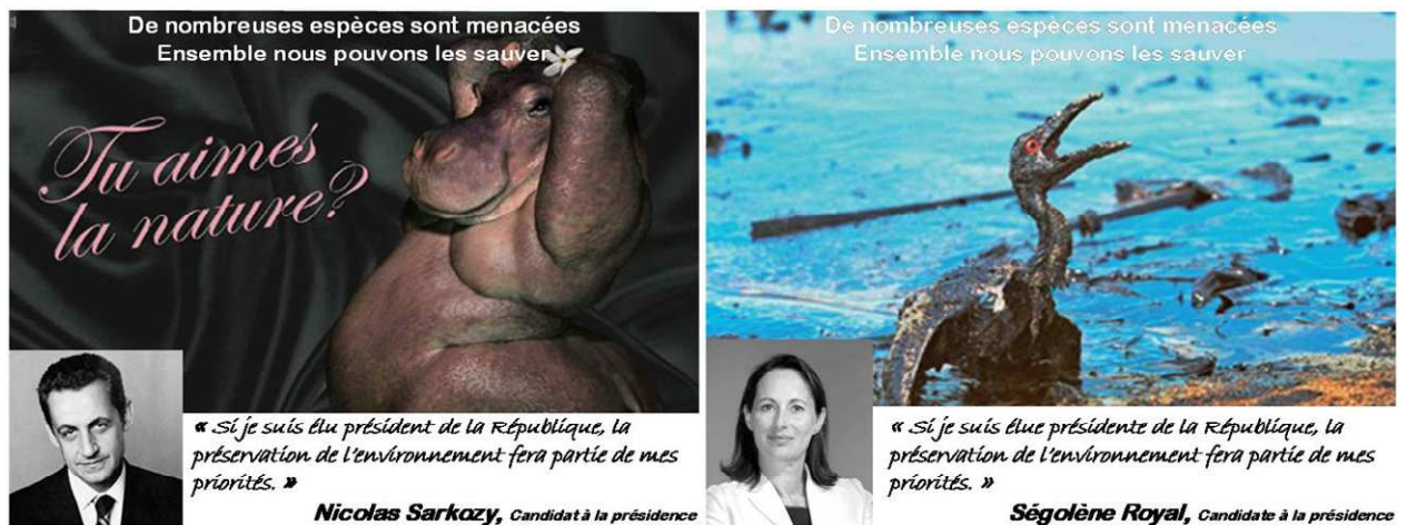
Figure 2 : exemples des visuels utilisés

Deux visuels proches de ceux de la Fondation Nicolas Hulot ont été utilisés. Des visuels publicitaires papier permettent de maîtriser un maximum de paramètres. De plus, l’affiche est un support de communication classique lors des campagnes électorales françaises. Seule l’image a été manipulée pour obtenir le procédé d’attention désiré, le texte et la photo des candidats apparaissent de façon identique sur tous les visuels (encadré 1). Seul le texte associé au visuel est modifié selon le type de procédé concerné. Nous avons contrôlé le fait que les répondants ne connaissaient pas les visuels au préalable.