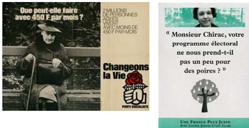
Figure 1 : Exemple d'affiches du Parti Socialiste.