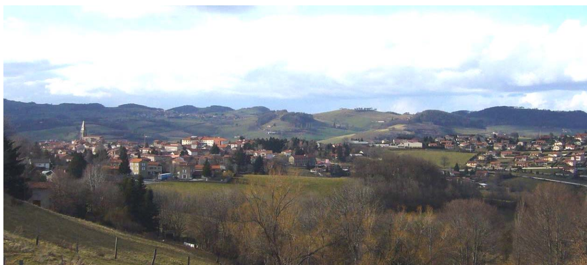
Saint-Martin-en-Haut, avec le centre bourg sur la gauche et les extensions pavillonnaires sur la droite

deux mois de revenus pour les ménages qui accèdent à la propriété dans les secondes couronnes périurbaines. La qualité de vie de ces ménages est aussi affectée par le temps perdu : sur les routes semi-montagneuses entre Mornant et Saint-Martin-en-Haut, le temps supplémentaire consacré par chacun des adultes à se déplacer vers son lieu de travail est de 40 minutes par jour ! Ces conséquences sur la vie quotidienne des ménages périurbains accentuent les effets de la ségrégation socio-spatiale : non seulement les ménages les moins fortunés se trouvent exclus des communes périurbaines aisées, mais ils se trouvent appauvris par des dépenses supplémentaires et leur vie familiale est perturbée par le temps perdu dans les déplacements.