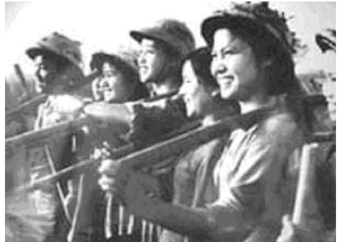
Thanh niên xung phong Hà Nội trong tuyến lửa miền Trung năm 1965

làm bè để vượt sông, lấp hố bom, phá bom nổ chậm, vận chuyển hàng quân nhu, khí tài và lương thực cho các chiến sĩ ngoài mặt trận 21 . Nói rõ ra, họ đảm bảo công tác hậu cần đặc biệt cho cuộc chiến tranh này.