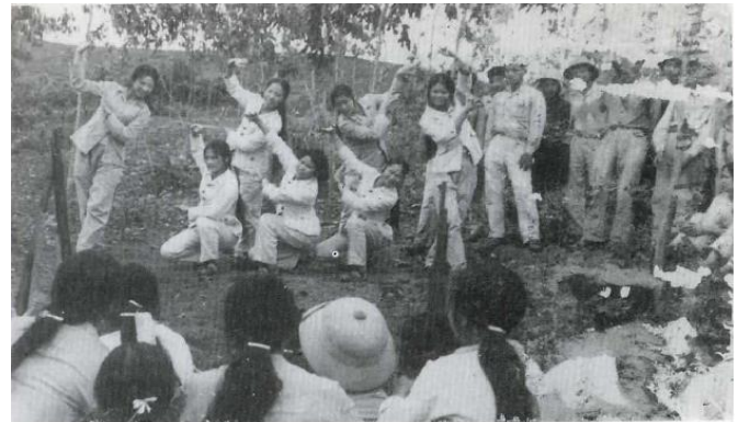
Nữ Thanh niên xung phong đang múa hát tại hiện trường. Nguồn: Nguyễn Văn Đệ, Một thời oanh liệt của nữ TNXP , Nxb GTVT, 1997.

hóa học lên thân thể các TNXP được kể ra. Tức là người ta biết điều ấy, biết rằng tiếng nổ điếc tai của bom, mảnh pháo để lại những vết hằn không thể phai. Trong địa ngục của chiến tranh, dù có những niềm vui hiếm hoi, cuộc sống thường nhật của TNXP đắm chìm trong thất vọng mênh mông, một nỗi đau khó tả; ở đó sự sống và cái chết dính chặt vào nhau, ở đó có sự táo bạo và can đảm, đôi khi máy móc, làm thành một bản năng tuyệt vời cho sống còn.