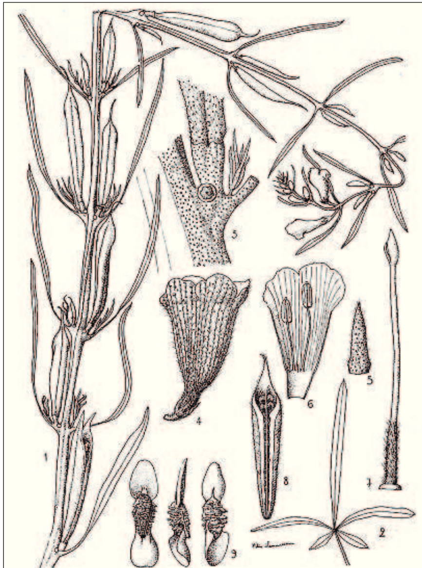
FIG. 155. — Sesamum alatum Thonn.

1. Rameau fleuri et fructifère réduit aux 2/3. — 2. Feuille réduite aux 2/3. — 3. Mode d'insertion de la feuille et du fruit. — 4. Fleur \times 2 . — 5. Sépale \times 6 . — 6. Partie de la corolle, face interne, et étamines \times 2 . — 7. Pistil \times 4 . — 8. Coupe du fruit, gr. nat. — 9. Graine \times 4 , sur trois faces.