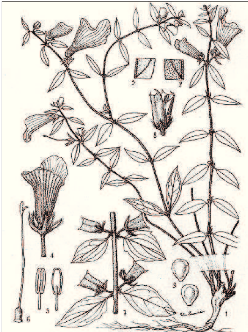
FIG. 154. — Ceratotheca sesamoides Endl.

1. Aspect général, réduit aux 2/3. — 2. Détail du limbe, face sup., \times 2 . — 3. Détail du limbe, face inf., \times 2 . — 4. Fleur, gr. nat. — 5. Anthère \times 4 , sur deux faces. — 6. Pistil \times 2 . — 7. Rameau fructifère réduit aux 2/3. — 8. Fruit ouvert, gr. nat. — 9. Graines \times 4 .