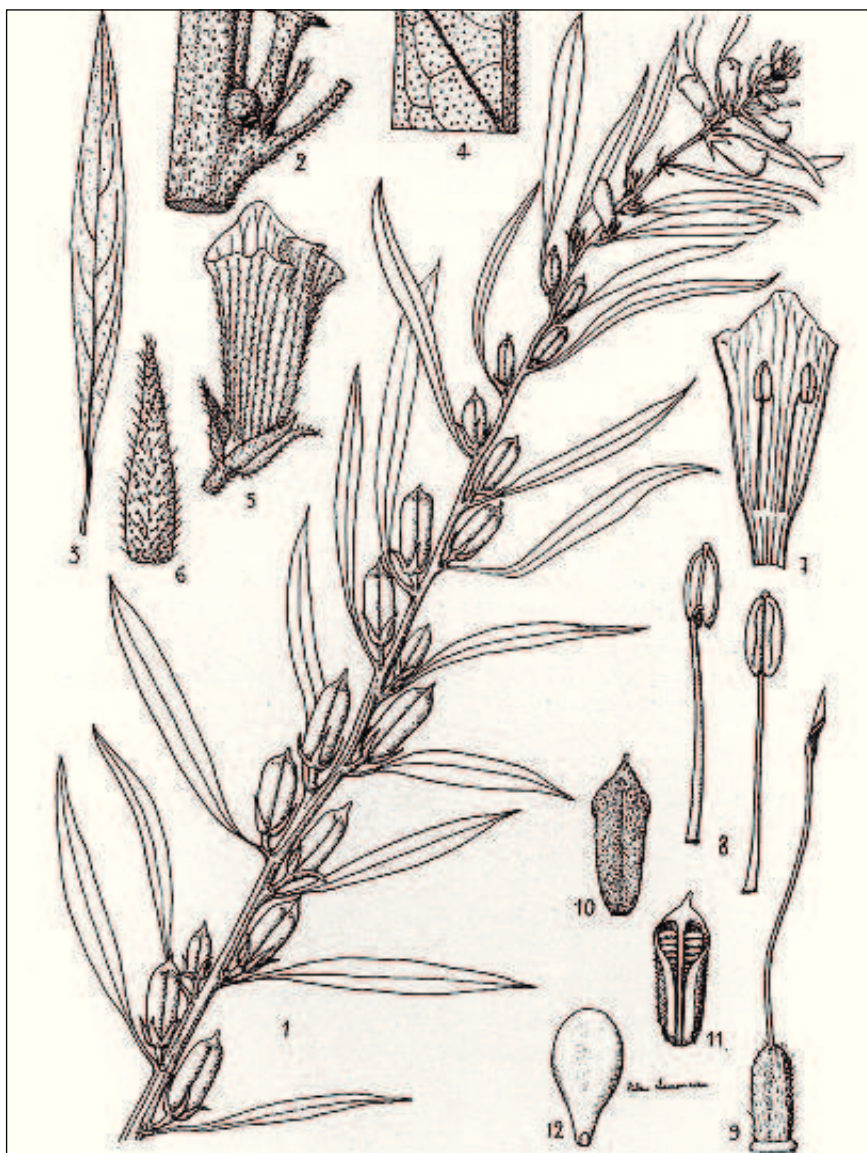
Fig. 156. — Sesamum indicum L.

1. Rameau feuillé, fleuri et fructifère. — 2. Mode d'insertion du fruit et de la feuille. — 3. Feuille, gr. nat. — 4. Nervation du limbe, face inférieure. — 5. Fleur \times 2 . — 6. Sépale \times 4 . — 7. Partie de la corolle, face interne, \times 2 . — 8. Etamine \times 4 , deux faces. — 9. Pistil \times 4 . — 10. Fruit, gr. nat. — 11. Partie du fruit, gr. nat. — 12. Graine \times 6 , face et profil.