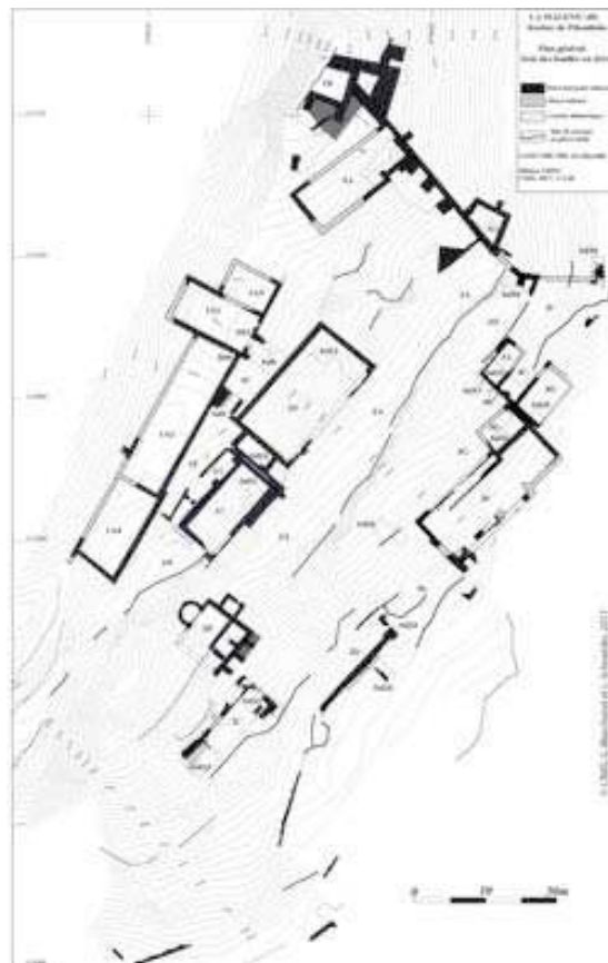
[Plan page 319, figure 392]

gestion des déblais impose d'inscrire le projet scientifique dans un projet plus général d'aménagement et de valorisation du lieu.