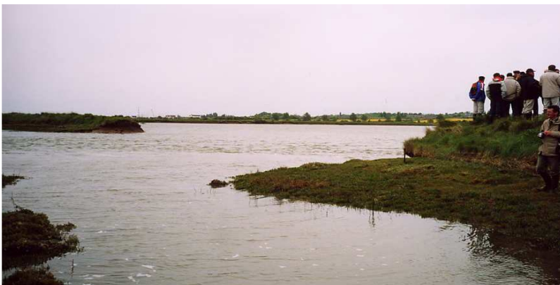
Document 1 : La brèche longue de quelques dizaines de mètres sur le site de Tollesbury, qui devient un lieu de visite (photo : V. Bawedin, mai 2003).

Le but ici était double : favoriser le retour du schorre, en voie de raréfaction en Angleterre étant données les poldérisations nombreuses qui ont eu cours, et expérimenter un retrait contrôlé pour évaluer les potentialités des prés salés à défendre les côtes contre l'élévation de la mer. Cette technique de retrait, bénéfique tant d'un point de vue écologique qu'humain et économique, est maîtrisée et contrôlée par les aménageurs, d'où son nom de « retrait contrôlé » (Goeldner, 1999), ou encore retrait planifié. L'ensemble des acteurs locaux salue aujourd'hui cette initiative, les riverains participant même au suivi de l'évolution du schorre.