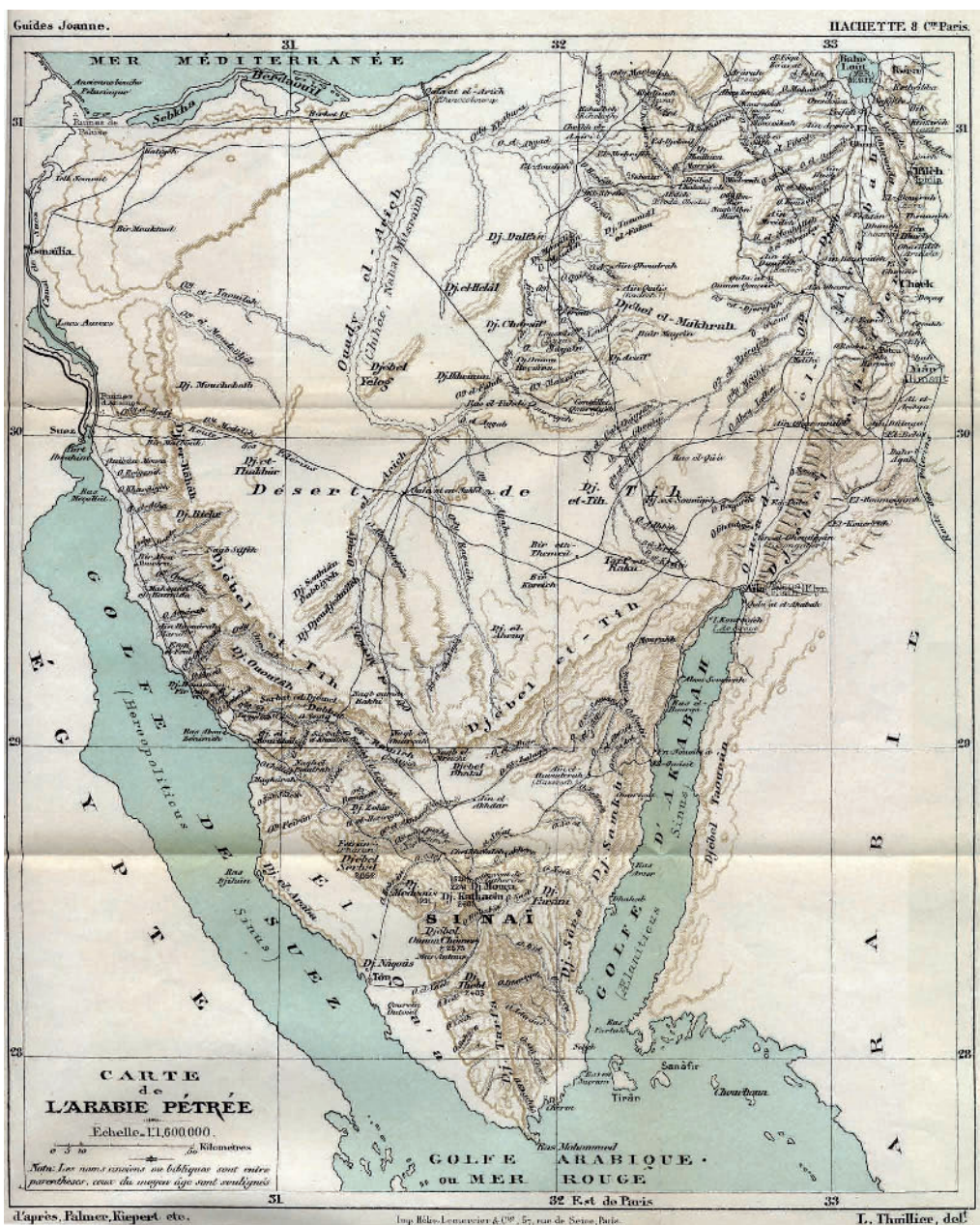
Fig. 4 : « Carte de l'Arabie pétérée » reproduite dans deux volumes de la trilogie et dans l'extrait Péninsule Sinaïtique .

Cette formule permettait de rentabiliser la coûteuse cartographie en couleurs (fig. 4). Dans notre exemple, la même carte dépliant est apparait dans trois volumes différents : II, Égypte-Abyssinie (1881), le portfolio lié à III, Syrie-Palestine (1882) et enfin l'extrait Péninsule Sinaïtique (1891). Les voyageurs qui n'auraient peut-être pas acquis le volume complet consacré à l'Égypte pouvaient acheter un petit ouvrage traitant de leur excursion. La même formule sera ensuite appliquée pour Bosnie-Herzégovine (1897) et Le Caire (1909) : ces extraits deviennent des monographies autonomes.