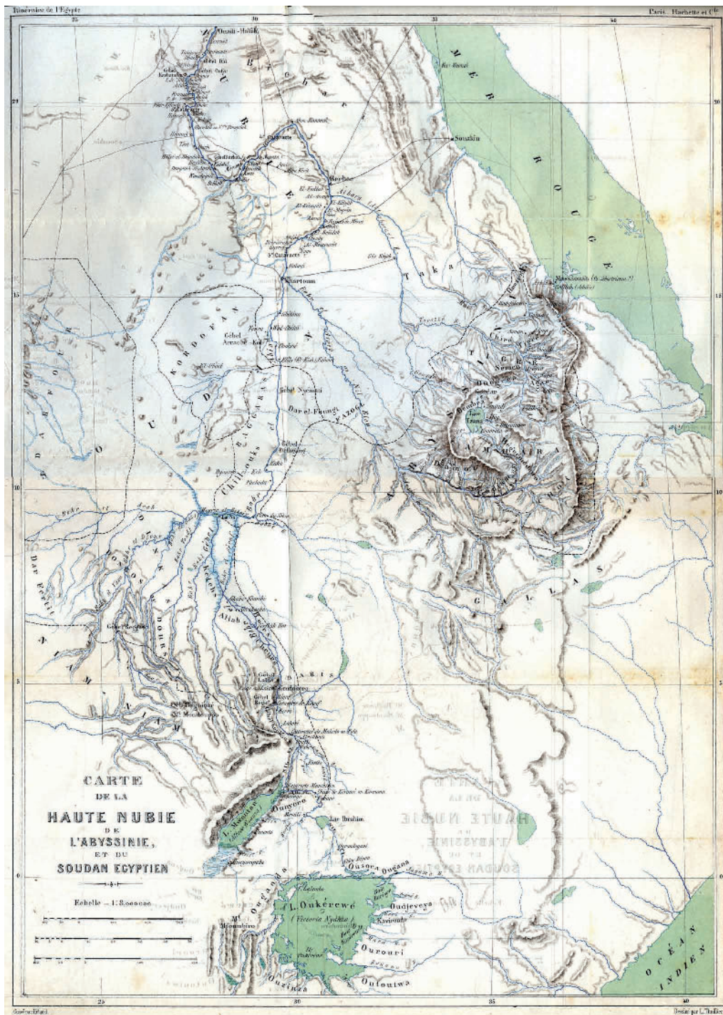
Fig. 3 : « Carte de la Haute Nubie, de l'Abyssinie et du Soudan égyptien », extraite de ISAMBERT 1878, insérée entre les p. 668 et 669.

du Soudan» 29 , sont indiqués très brièvement les moyens de transport (le bateau à vapeur principalement) et quelques grands traits sur les régions traversées jusqu'à Gondokoro, siège d'une garnison de tirailleurs du protectorat anglais de l'Ouganda.