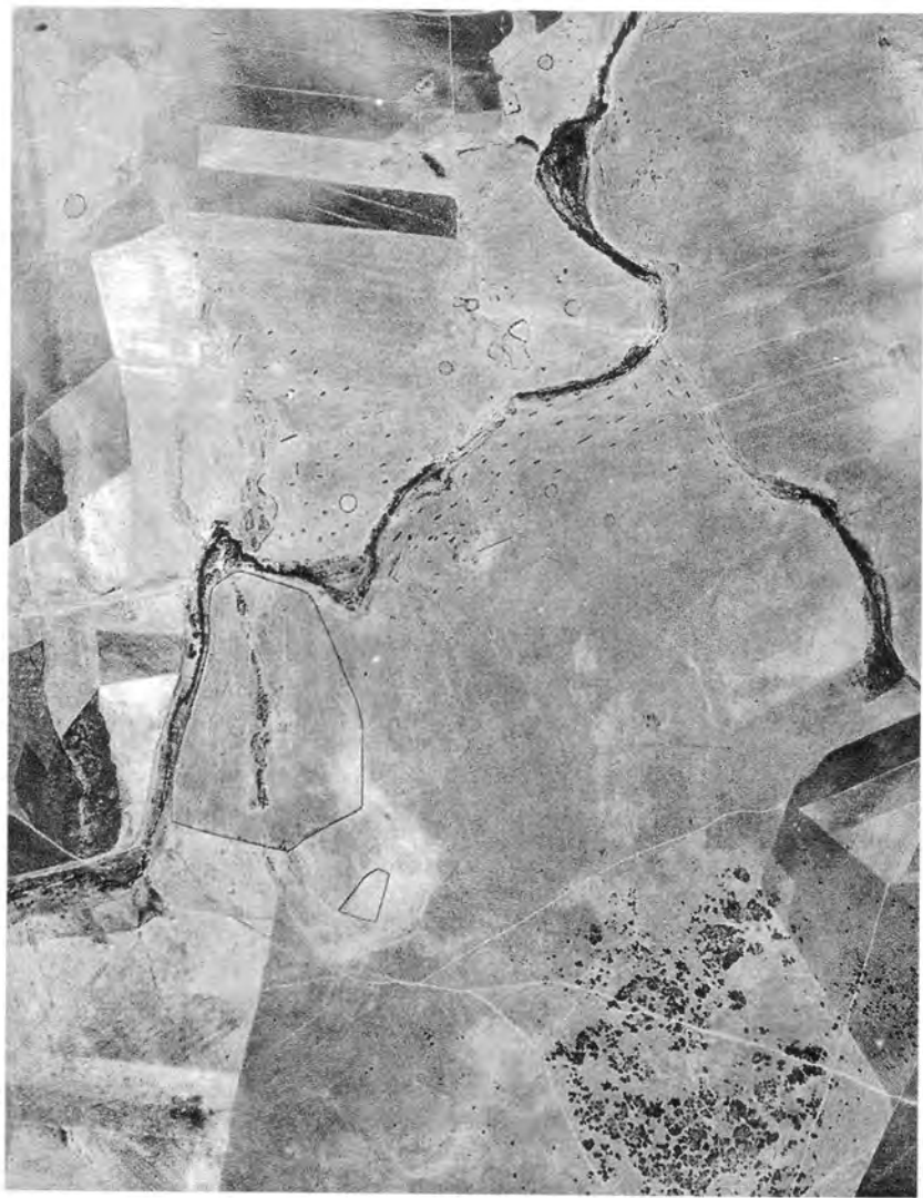
Fig. 29.El Pedrosillo (Casas de Reina). Fotografía aérea (J. G. Gorges & G. Rodríguez Martín).