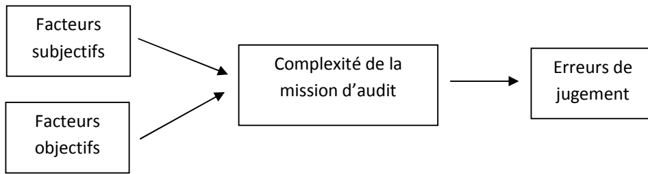
Schéma 1 : Facteurs de complexité de la mission d'audit et erreurs de jugement

Cet article a donc pour but de montrer que les éléments objectifs de la complexité de la tâche de l'auditeur peuvent entraîner également des erreurs de jugement et qu'il faut leur accorder une attention suffisante. A la suite d'une revue de la littérature sur les facteurs explicatifs de la complexité de la tâche, nous testerons à l'aide de quelques cas significatifs des propositions qui nous paraissent essentielles pour comprendre le rôle de ces éléments objectifs dans les erreurs de jugement de l'auditeur.