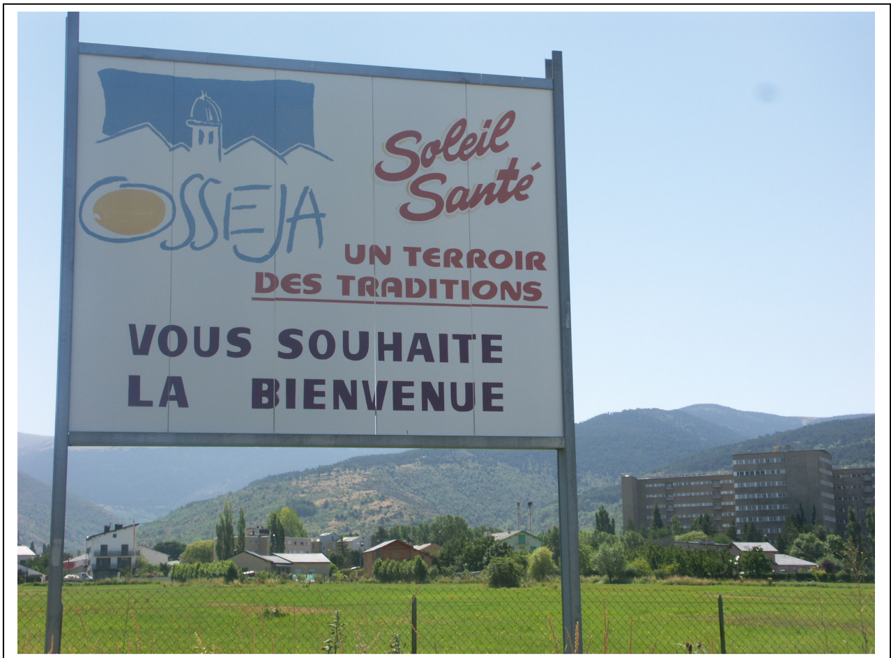
Fig. 4 — Un ancien sanatorium reconverti en établissement sanitaire et social à Osséja.

En 1985, alors que le déclin et la conversion se sont amorcés, les établissements sanitaires du plateau cerdan étaient encore au nombre de 22 et avaient une capacité totale de l'ordre de 2100 lits (Mouls, 1987). La loi de juillet 1991 qui a instauré les Schémas régionaux d'organisation sanitaire (SROS), première étape importante en matière de planification de l'offre hospitalière dans des cadres régionaux, a remis en cause les possibilités de recrutement extra régional des patients. Les ordonnances Juppé de 1996 ont concrétisé la montée en puissance de la région comme niveau de la régulation en matière d'offre de soins hospitaliers. Le Directeur de l'Agence régionale de l'hospitalisation (ARH) devient l'acteur fort de cette nouvelle gouvernance. Les réflexions conduites en Languedoc-Roussillon dans le cadre de la préparation des SROS sur l'adéquation entre offre et besoins ont eu pour effet de rendre manifeste un excédent ou une inadéquation de l'offre cerdane par rapport aux besoins des populations de la région ou éventuellement des régions voisines. Ce constat a tout particulièrement touché les centres climatiques de montagne, de plus en plus privés de leur clientèle extra régionale. Le processus de rétraction pour les seuls besoins régionaux et locaux a été renforcé avec le SROS 3 (2006-2010). Ce qui, pour les Pyrénées orientales, a signifié le renforcement de l'offre dans l'agglomération de Perpignan et la plaine du