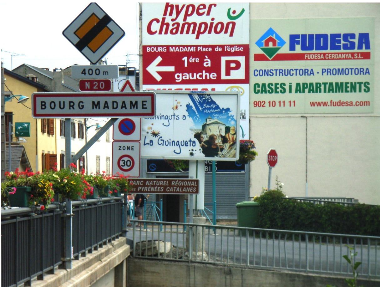
Fig. 3 — L'entrée de Bourg-Madame vue depuis la frontière sur le Rahur.

Si les échanges entre les parties française et espagnole de la Cerdagne se sont développés, en particulier depuis l'essor du tourisme d'hiver, la frontière est restée étanche dans le domaine des soins, chaque système national de santé gardant ses spécificités. Du côté français, l'économie locale a bénéficié de la construction, à partir des années 1920, de nombreux établissements sanitaires implantés en Cerdagne au nom des bienfaits de l'ensoleillement et de la sécheresse de l'air ambiant. Cet argument climatique reste en vigueur (fig. 4) mais les logiques nationales de régionalisation de l'offre de soins ont imposé une rétraction des aires de recrutement et, en conséquence, une réduction de l'offre.