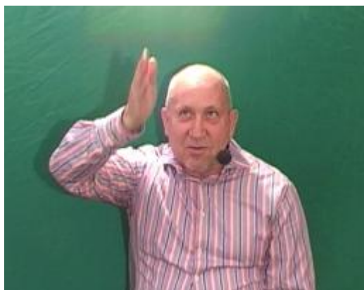
Figure 1: La mire (compteur 1.06)

alignées pendant un laps de temps suffisant 4 . D'autres segments peuvent s'ajouter à cet alignement : le dos de la paume et l'avant-bras voire le bras. Dans certains cas, que nous aborderons, la direction du regard passe par le bout des doigts pointés vers le haut tout comme la main, et vise une zone vers l'avant comme on le ferait d'une cible avec un fusil muni d'une mire verticale dont l'extrémité est orientée vers le haut : la mire verticale est donnée par le bout des doigts étendus. Le corpus étudié montre des exemples de ces pointages/mires pour lesquels la direction du pointage ne dépend pas de l'alignement des segments gestuels. Ainsi, pour analyser le pointage, on peut dissocier alignement gestuel, directionnalité et mouvement.