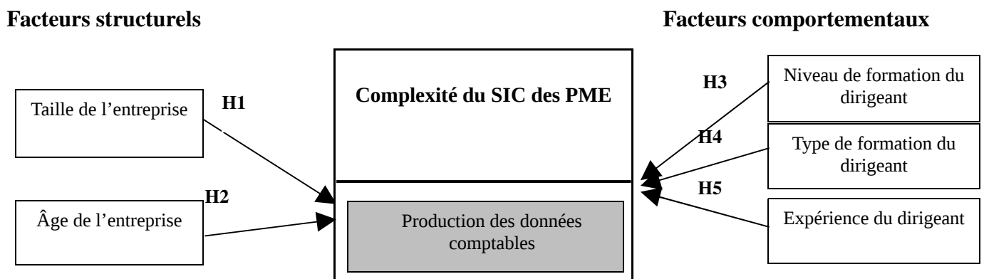
Figure 1 : Le cadre de la recherche

Schématiquement, le cadre de recherche se présente ainsi :