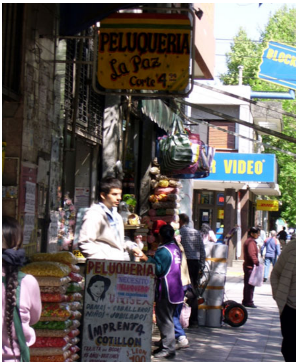
Figure 3 - Un territoire marqué par les migrants : le quartier de Liniers, Buenos Aires.

Dans le centre de Buenos Aires, ce quartier est approprié par les migrants boliviens et, dans une moindre mesure, péruviens. Au premier plan, un salon de coiffure porte le nom de la capitale bolivienne et ses prix défient toute concurrence. Des migrants d'origine bolivienne (les femmes aux longues nattes et au tablier, premier, troisième plan) viennent acheter des produits alimentaires typiques de Bolivie dans les boutiques voisines (des sacs de pâtes, de chips et pop corn colorés en grande quantité). Les produits sont empilés, posés sur la rue, accrochés : cette manière de présenter rappelle plus les boutiques de La Paz que celles de Buenos Aires. Au dernier plan, de l'autre côté de la rue, des magasins courants à Buenos Aires : « Blockbuster », chaîne internationale de location de vidéos, et « DHL », spécialisé dans les envois de colis.