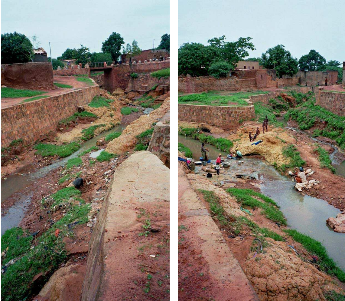
Cliché 13. Les trois cours d'eau sacrés: Kunu , Sanyo , Houet se rencontrent au quartier Tounouma (secteur 1) à Bobo-Dioulasso.