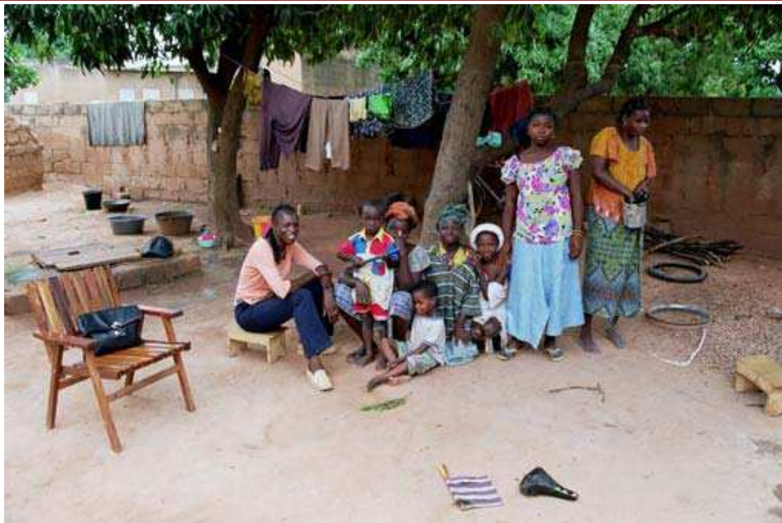
Cliché 7. La journée, les hommes sont absents de la maison et c'est avec une grande courtoisie que les femmes ont accueilli les enquêteurs.

Le dérangement occasionné dans l'arrêt de l'activité en cours n'est jamais signifié ni même vraiment ressenti car la sociabilité l'emporte toujours sur l'activité ! Évidemment, le riche est plus visité que le pauvre et l'absence de visite est un signe qui ne trompe pas sur la perception que les autres se font de votre pauvreté. Par contre, la fréquence des visites des voisins et leur irruption dans la vie quotidienne est plus difficile à maîtriser. Ces relations sont courtoises, mais les échanges restent limités, comme les contacts, aux salutations d'usage, à des visites « pour dire bonjour ». Elles ont tendance à prendre un aspect formel correspondant au code des salutations qui gère les interactions interindividuelles.