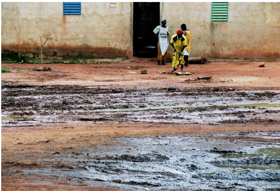
Cliché 24. Secteur 9 (Konsa). En hivernage, les eaux de pluie, les eaux usées domestiques et les excréta stagnent lamentablement. Elles se mélangent pour produire une fange immonde qui fait pourrir la base des habitations. Une jeune fille est sortie de sa cour pour couper du bois..

Comme nous l'avons vu (Cf.), les eaux usées constituent un marqueur de l'expansion du territoire privé de la cour, mais elles peuvent aussi agir comme un agent de violation du territoire de l'autre. Ce « débordement » de la gestion de l'espace domestique de l'un peut-être perçu par l'autre comme une intrusion, comme une forme de sociabilité agressive qui le déconsidère.