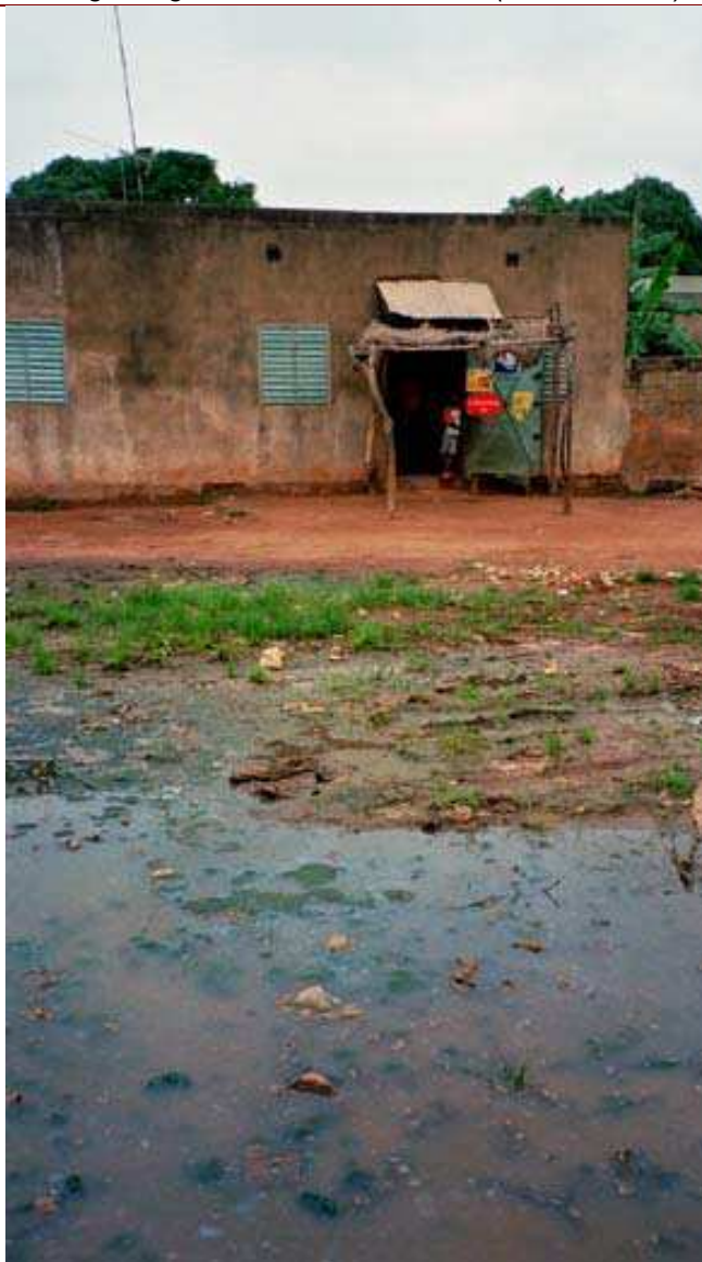
Cliché 25. Les mares d'eaux usées couvertes de mousses verdâtres dégagent une odeur pestilentielle

C'est souvent le conformisme 122 qui prévaut en ce cas, un modus vivendi qui souligne la priorité du principe de co-existence locale et surtout le souci de sa continuité. Quand les protagonistes peuvent s'appuyer sur des normes de bienséance et une éthique du savoir-vivre en société, partagés. Ils reconnaissant le coût social de la honte et tentent d'élaborer un consensus sur la manière de négocier et sur l'enjeu de la négociation. Ils inventent des conventions, pragmatiques, qui règlent l'étendue des conduites réciproquement acceptables : la tactique dominante consiste toujours à maintenir les règles pragmatiques du jeu social localement défini (Bouju, 1998).