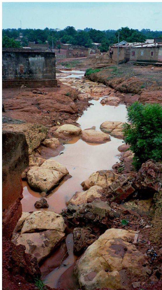
Cliché 17. Le marigot Houet. À Dioulassoba, centre-ville de Bobo-Dioulasso