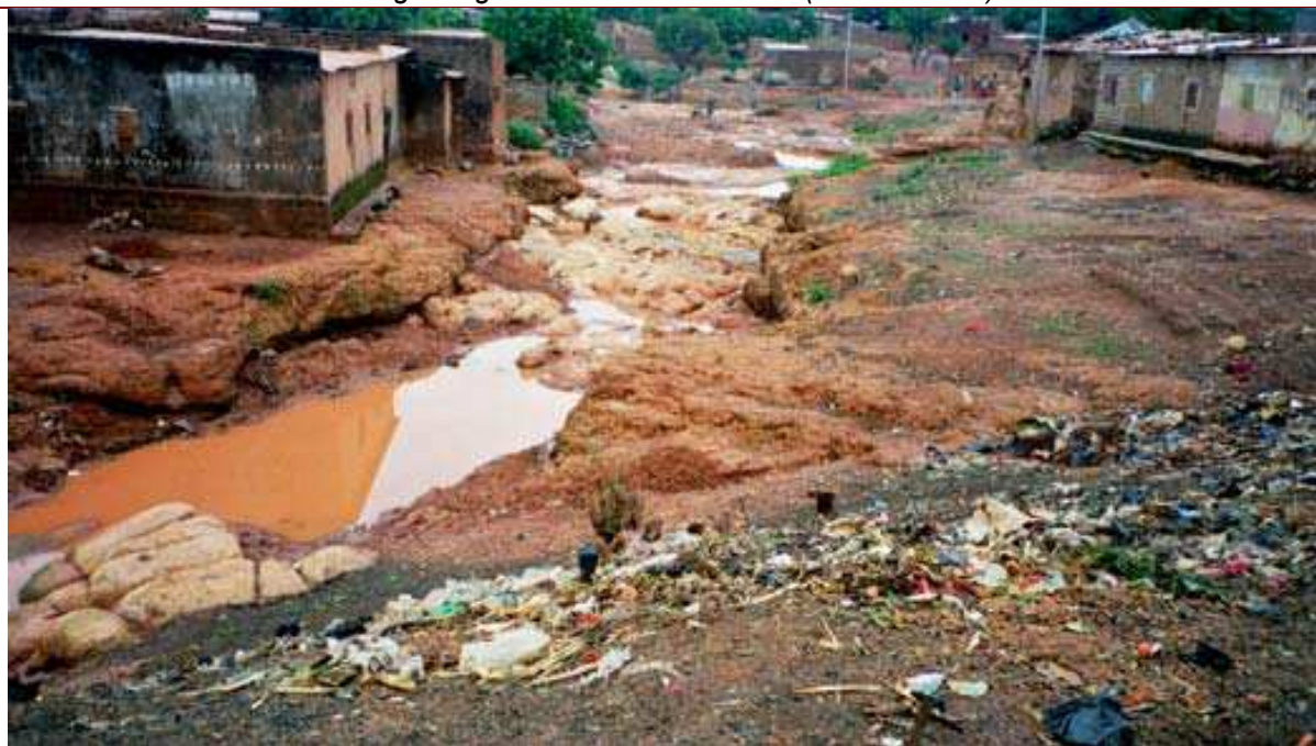
Cliché 10. Tas d'ordures sur les berges du Houet (en amont du pont) au « village » de Tounouma, centre-ville de Bobo-Dioulasso