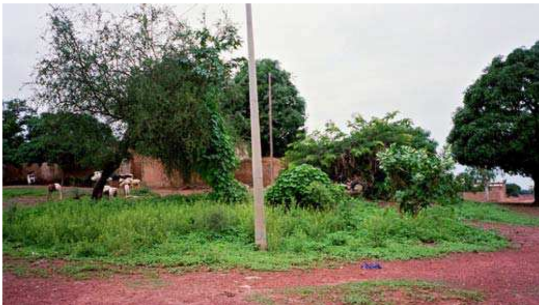
Cliché 8. L'autel de Dwo et le bois sacré sogo du « village » de Tounouma, près des berges du Houet, au secteur 1 (centre-ville) de Bobo-Dioulasso