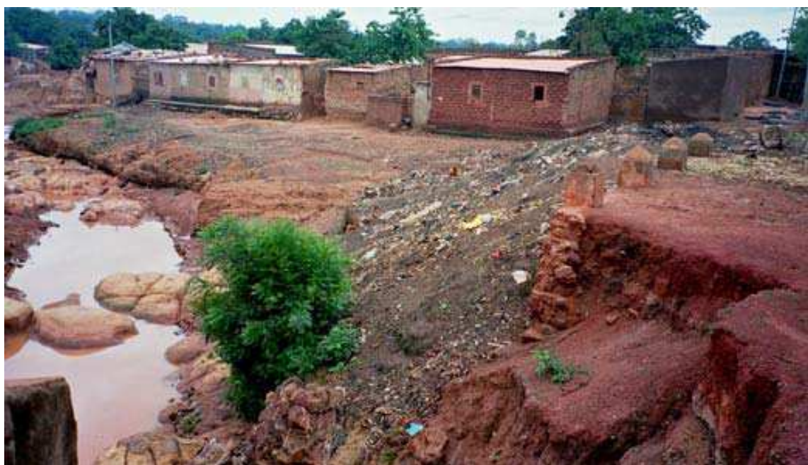
Cliché 11. Tas d'ordures sur les berges du Houet (en aval du pont) au « village » de Tounouma, centre-ville de Bobo-Dioulasso (cliché Bouju, 2001)