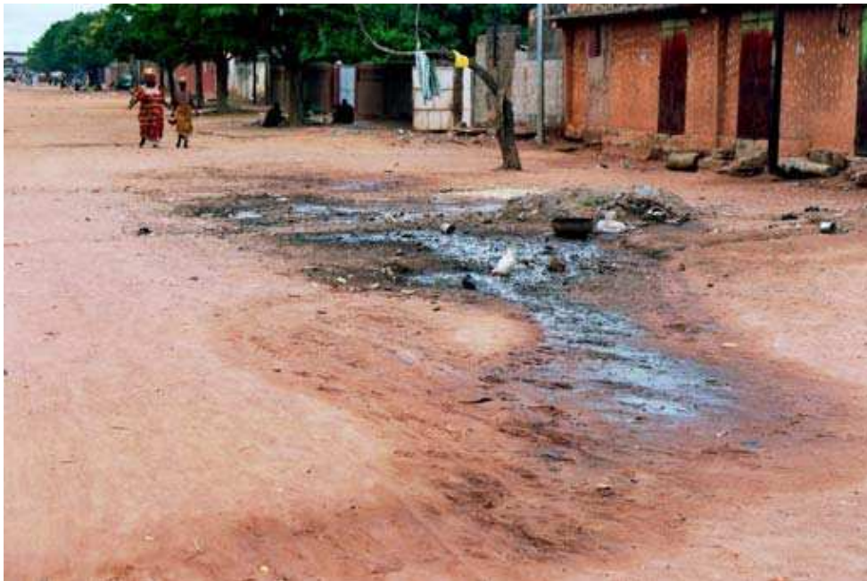
Cliché 23. Secteur 12 (Niénéta). « Quelqu'un » a vidangé ses excréta près d'un tas d'ordures en formation au milieu de la rue.

Salir l'espace public, c'est exprimer la contrariété, l'opposition, le défi ou le mépris en retour : « l'injure suprême par quoi est signifié à l'autre ce qu'il est en essence : rien que de la merde. » (Knaebel, 1991 : 26).