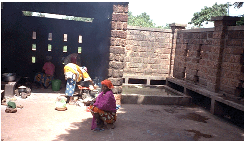
Cliché 20. Proximités paradoxales à l'hôpital de Bobo-Dioulasso : la cuisine à droite à côté des latrines ouvertes à gauche