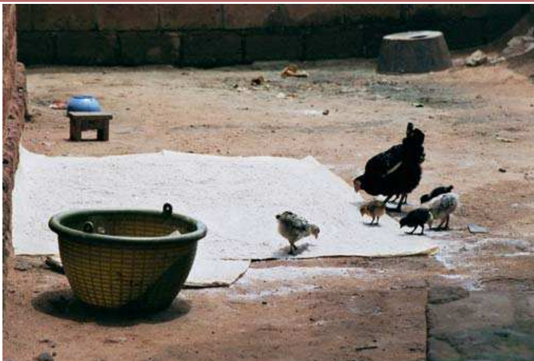
Cliché 6. Dans la même cour d'habitation, la poule visible sur le cliché précédent est rejointe par ses poussins qui picorent et piétinent la farine de mil que la maîtresse de maison vient de mettre à sécher pour cuisiner le repas du soir.