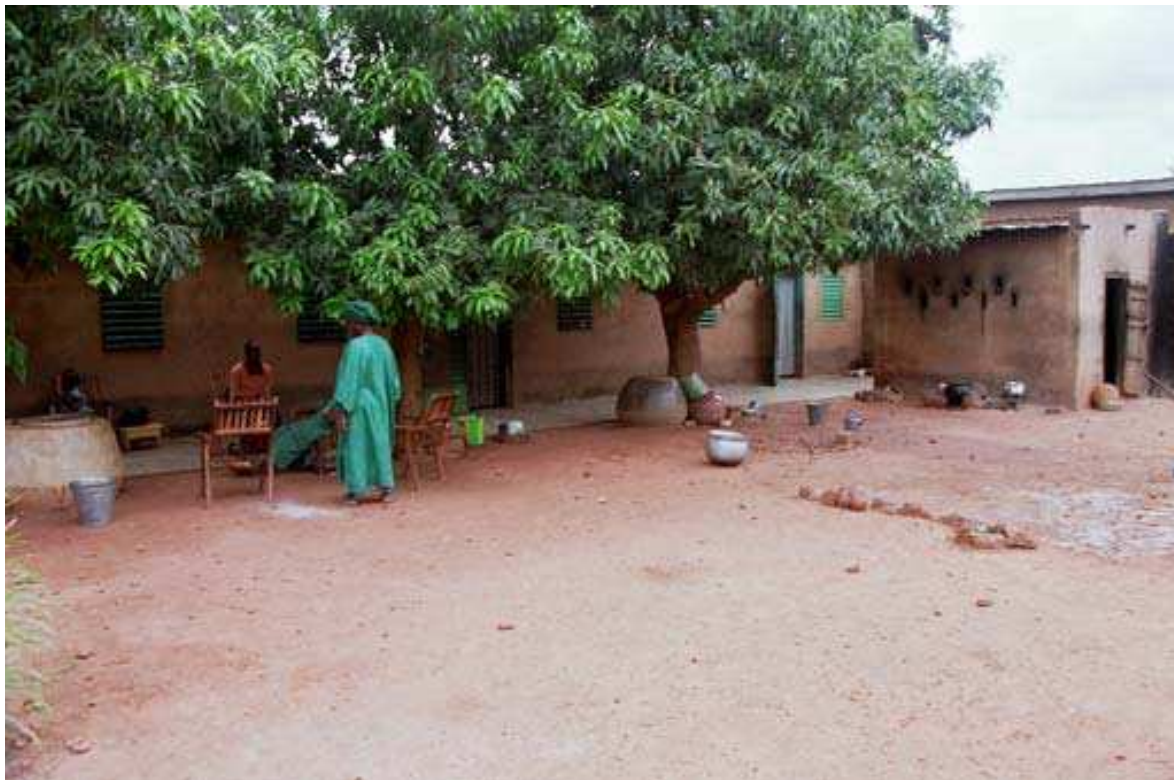
Cliché 3. On notera les deux grandes jarres d'eau en béton : une devant la porte de chaque épouse. La cuisine commune se trouve à gauche sur le cliché.

Le fait de placer la jarre dans la cour s'explique par le manque de place à l'intérieur de l'habitation, mais surtout par le fait de rendre l'eau de boisson accessible à toute la famille et aux étrangers en l'absence de la mère de famille :