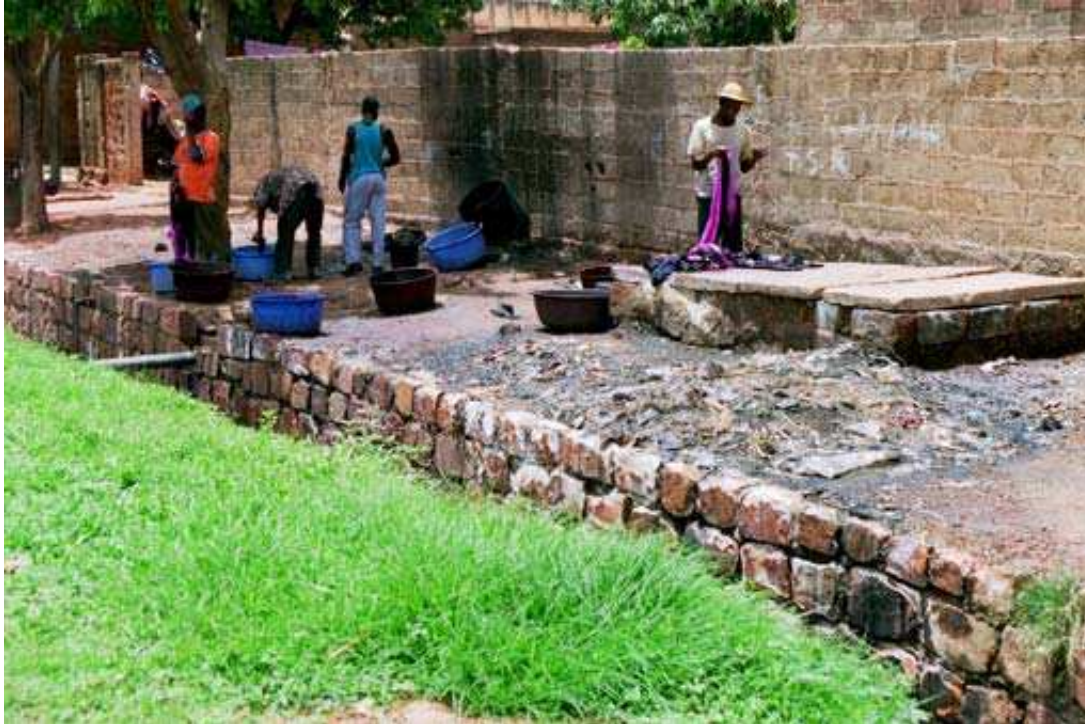
Cliché 18. L'avenue de la révolution, la grande avenue de Bobo-Dioulasso, n'est pas épargnée par les nuisances. Ici des teinturiers travaillent sur le trottoir, à l'extérieur de leur cour, et versent leurs eaux usées directement dans le canal d'évacuation des eaux pluviales.

tomber dans le vagabondage, la prostitution, le trafic de drogue et la mendicité. Toute cette activité productive et commerciale fait de la rue un territoire vital que cette foule s'approprie avec constance et obstination. « (...) obstination allant à l'encontre des nombreuses tentatives faites pour prohiber ou réglementer les petits métiers de la rue. » (Korosec-Serfaty, 1991 : 32). C'est en partie à cause de la prolifération des activités économiques du secteur informel que les espaces publics sont sales et dangereux.