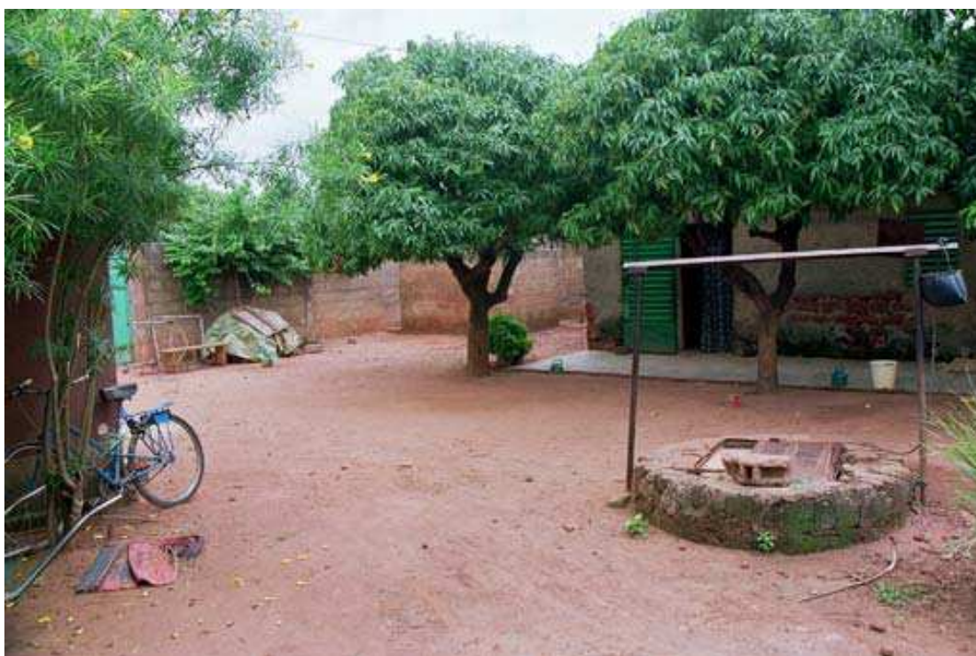
Cliché 1. Le portail d'entrée (de couleur verte) est à gauche. Le puit trône au milieu de la cour. Les latrines traditionnelles se trouvent au centre du cliché, juste derrière le manguier.