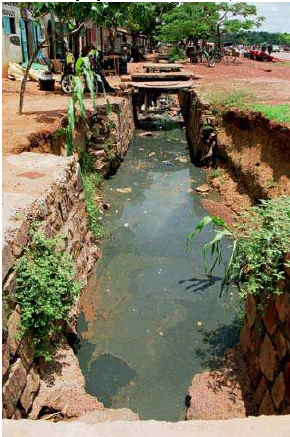
Cliché 19. Les produits détergents que les teinturiers utilisent attaquent la vieille maçonnerie du canal d'évacuation des eaux pluviales qui s'effondre progressivement

Ce monde des petits métiers de la rue, souvent analphabète, est donc fait de gens qui survivent en ne respectant pas, bien sûr, les normes qui réglementent l'activité de production, d'échange ou de déplacement dans l'espace urbain. À Bobo, c'est évidemment la population pauvre, la plus nombreuse et la plus démunie, qui constitue leur clientèle et cette population urbaine reste solidaire de ces colporteurs et de ces artisans. Les modes d'usage de l'espace public par les femmes vendeuses de légumes, tenancières de « restaurants-par-terre » et de tabliers divers, les jeunes colporteurs et les pauvres risquent d'être plus étroitement contrôlés dans le sens du respect des règlements municipaux et des pouvoirs publics. La question de la normalisation de leur activité par les autorités