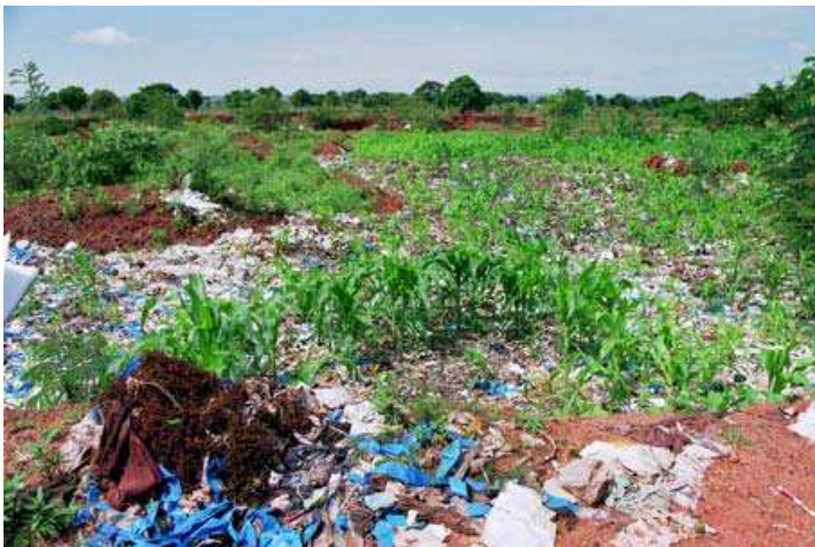
Cliché 12. La culture dans l'ordure et le plastique comme engrais. Champ de mil dans le dépôt de Sonsoribougou (aéroport). (cliché Bouju, 2001).

La seule nuisance que l'on commence à évoquer, en ville, tient à leur prolifération et à leur concentration en certains lieux sous l'effet du vent :