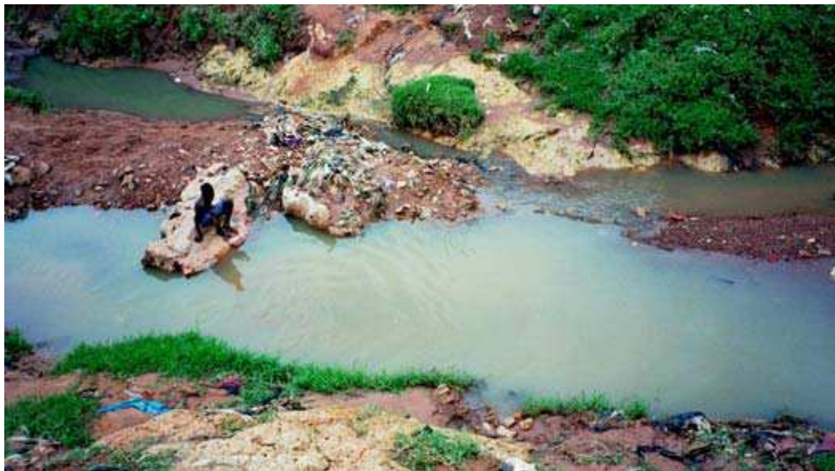
Cliché 16. Les silures sacrés y abondent et se montrent facilement (ci-dessus à droite de la photo).

Dans la tradition bobo madarè , les sources, les points d'eau, les rivières sont considérés comme chargés de forces mystérieuses. Ainsi, l'eau du sanyo 82 aurait des vertus médicamenteuses. Dans cette eau, il y a des poissons, des serpents et des caïmans et elle est protégée par des interdictions rituelles :