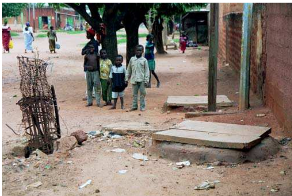
Cliché 9. Secteur 12 (Niénéta). Les puisards, mal couverts, constituent de véritables gîtes larvaires. On les place de préférence en-dehors de la cour, dans l'espace limitrophe (cliché Bouju, 2001)

Par souci d'éloigner la fange de l'espace de vie, on ne conçoit pas de les creuser à l'intérieur de la cour. Mais comme c'est « dehors », on ne prête guère attention à la solidité du dispositif et il n'est pas rare d'entendre que l'effondrement de latrines mal construites et de puisards à ciel ouvert ou mal couverts a entraîné un accident ou même une mort par noyade 78 .