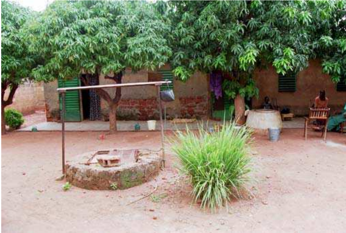
Cliché 2. L'espace de sociabilité se situe devant les chambres, sur la partie bétonnée de la cour, bien à l'ombre des manguiers. Quand les invités sont nombreux, l'espace de séjour et de repos peut s'étendre tout le long de la devanture en béton.