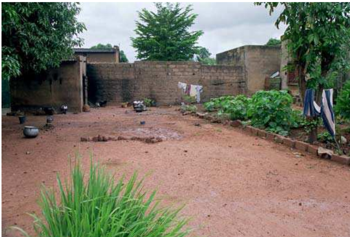
Cliché 4. L'espace de vaisselle (le lieu est encore tout mouillé) avec quelques récipients dispersés est toujours le même.

Le contraste est frappant entre l'extrême spécialisation des pièces (chambres, cuisine, latrine et douchière n'ont qu'un seul usage) et l'absence de séparation matérielle qui pourrait indiquer un partage de la cour en espaces d'activités spécialisés et en espaces de circulation. Seule, la présence d'un mobilier mobile et souvent rudimentaire (tabouret, nattes, chaises, tablettes) ou d'objets (« tasses », paniers, bassine à vaisselle, linge étendu à sécher, flaque d'eau sale, tas d'épluchures, etc.) signale au visiteur quelle activité vient de se tenir à l'endroit précis où il se trouve dans la cour.