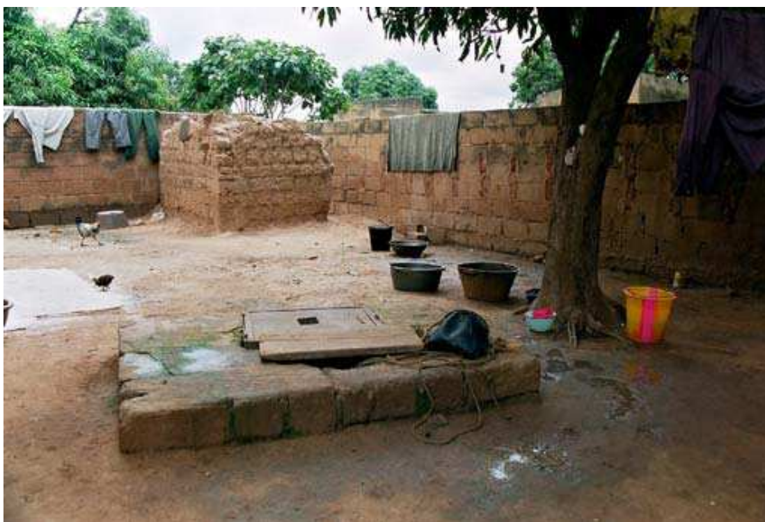
Cliché 5. Quartier Niénéta (secteur 12, Bobo-Dioulasso). L'eau stagne près du puits; le linge lavé sèche, posé sur la terre des murs. au fonds des latrines traditionnelles.

Le dispositif le plus répandu 47 pour le stockage de l'eau à usage domestique est celui du « canari » posé à même le sol. Cette technique présente beaucoup de risques de pollution par ce qu'il faut nécessairement plonger un gobelet dans l'eau pour les prélèvements.