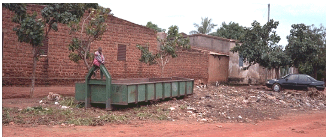
Cliché 21. Un « bac » vide sur un tas d'ordure où joue un enfant à Bobo-Dioulasso (cliché Ouattara, 2001)

Il semble bien que, dans un espace culturel partagé, ce qu'on redoute le plus, c'est le « regard de travers » des voisins qui donne la honte et qui porte atteinte à la réputation d'honneur de la famille. Ce qui est honteux à Bobo-Dioulasso, comme à Ouagadougou ou à Rabat (Jolé, 1991 : 38), ce n'est pas l'existence d'une décharge sauvage à proximité de la cour ou autour du bac à ordures municipal, c'est de se laisser surprendre le seau d'ordure à la main sur le chemin qui y mène ! En effet, à cause de la honte qu'éprouverait tout adulte, homme ou femme, qui serait vu par le voisinage porter lui-même ses ordures à la benne, on envoie les enfants le faire bien que leur taille soit trop petite pour qu'ils puissent arriver à les jeter par-dessus bord, et donc ils les jettent à côté !