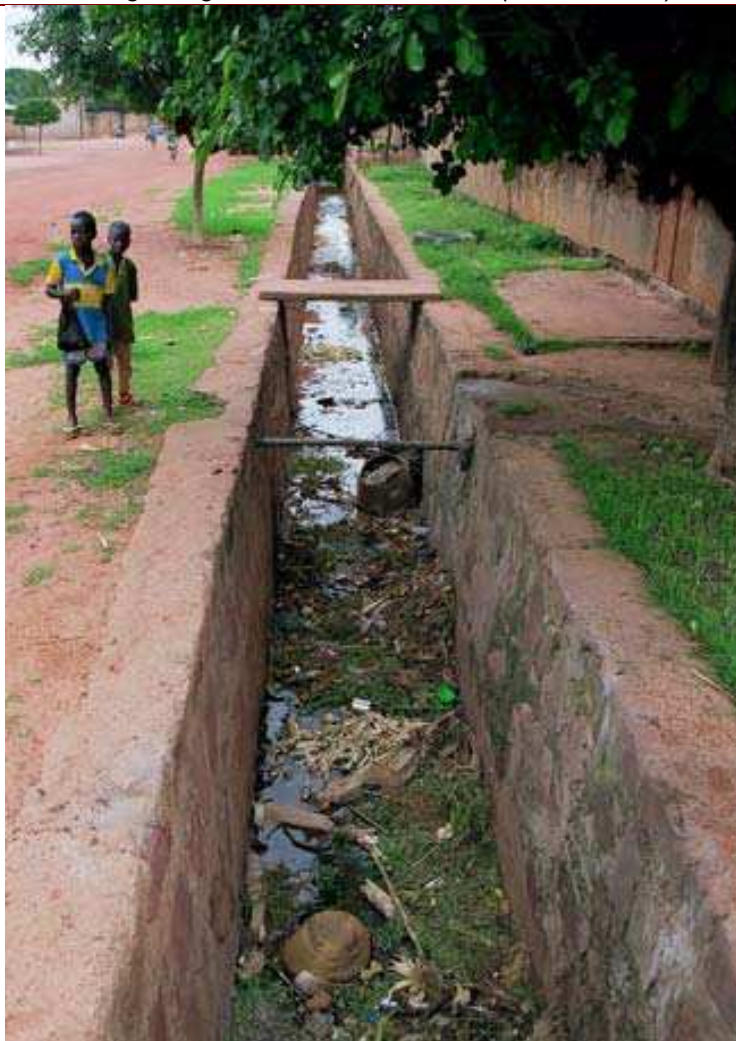
Cliché 14. Niénéta (secteur 12). Là où les canaux d'évacuation des eaux pluviales existent, ils sont bouchés, comme partout ailleurs dans la ville de Bobo-Dioulasso.