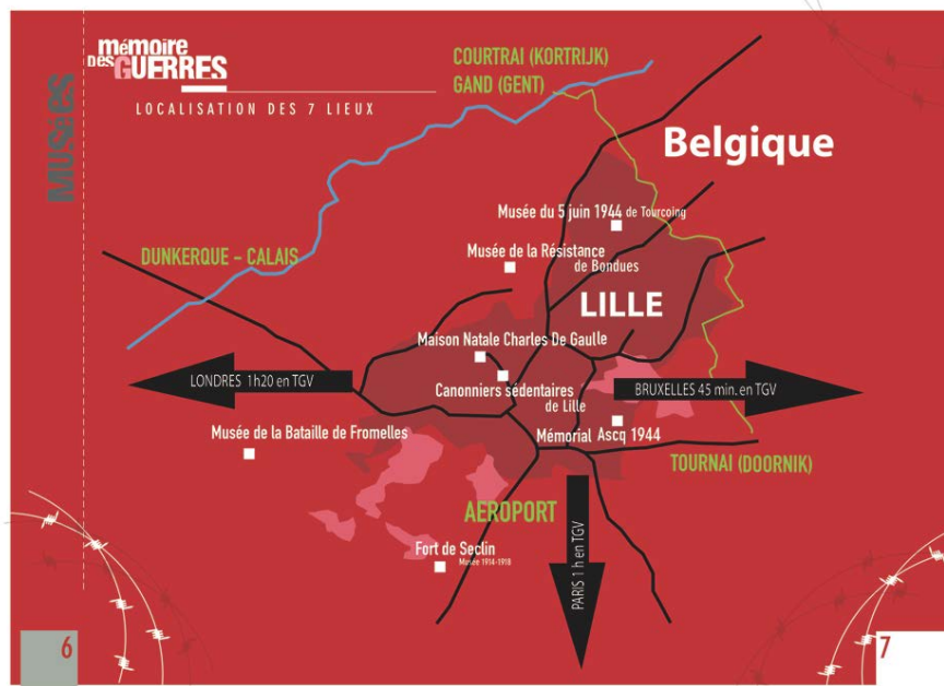
Ill. 1. Carte des musées du réseau informel « Lille Métropole. Mémoires des guerres », brochure de communication bilingue 2008, rééditée en 2010

musées étaient réelles. À une échelle régionale, le Comité Régional de Tourisme s'est positionné en 2008 pour développer des « Chemins de mémoire », afin de proposer et de promouvoir auprès de visiteurs des parcours thématiques territorialisés 38 , mais sans volonté particulière de coordonner les musées et les sites concernés. Le 8 juin 2012 39 , Jean-Pierre Rioux pensait, de manière utopique, à la potentialité du développement d'un GPS historique, qui permettrait à tout un chacun de se repérer géographiquement, tout en ayant accès à la sédimentation historique complète d'un lieu, donc une sorte de déclinaison à usage touristique d'une information à la fois générale et précise, homogénéisée par un travail commun exigeant.