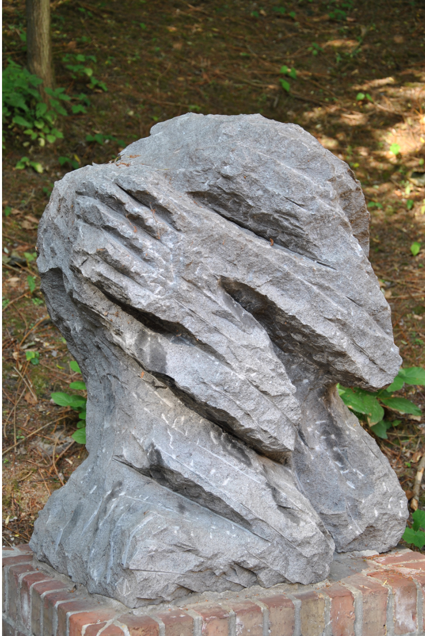
Ill. 3. Eugène Dodeigne, Témoignage , 1986, pierre de Soignies, H. 100 cm, L. 77 cm, P. 55 cm, Bondues, Fort Lobau, cour d'honneur dite sacrée, face au mur des fusillés

Depuis le 90 e anniversaire de l'armistice, grâce notamment à l'accompagnement financier du Département du Nord 54 , une partie de ces musées collabore grâce au réseau informel « Lille Métropole. Mémoire des Guerres », évoqué précédemment. Si une brochure bilingue (français/anglais, puis anglais/néerlandais) valorisait les sept lieux (Ill. 1), la « tête » de réseau change en fonction des projets opérationnels : le Musée de la Résistance de Bondues pour « 14-18. De la Résistance à la Libération » en 2008 et 2009, le Mémorial Ascq 1944 pour « 1944. De la répression et l'exaltation » en 2009 et 2010, la Maison