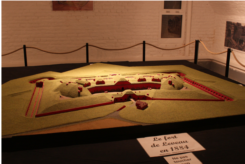
Ill. 2. Stéphane Lustremant, Le fort Leveau en 1884 , 2009, maquette, Feignies, Fort Leveau

Leveau à Feignies (Ill. 2), le musée de la Bataille de Fromelles 45 ou le Musée de la Cité d'Ercau à Erquinghem-Lys 46 . À l'instar de la nouvelle muséographie du musée Somme 1916 à Albert 47 ou d'un parcours encore plus individualisé (en fonction de la nationalité ou du sexe) au musée In Flanders Fields d'Ypres depuis juin 2012, ces musées valorisent ainsi, depuis leur création, des histoires individuelles, des parcours de vie bouleversés par la Grande Guerre, de personnes de toute nationalité ayant vécu sur ce territoire transfrontalier.