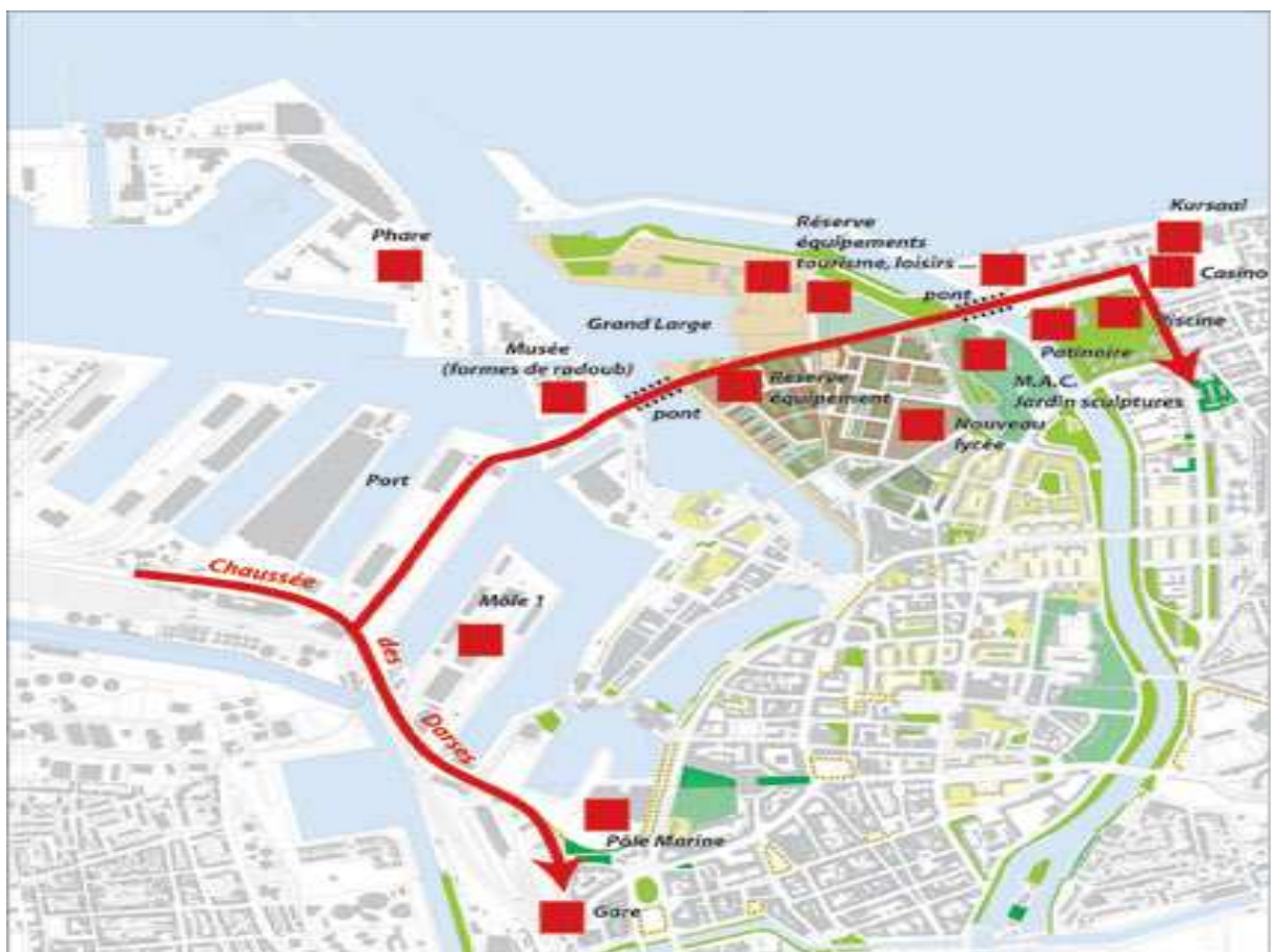
Fig. 6 : le Master Plan de Rogers.

Après cet épisode, un concours international est lancé, remporté par l'agence de Richard Rogers. La volonté est de créer un projet évolutif : « le master plan » de Rogers, montre les ambitions globales tout en laissant la place à de nouveaux projets.