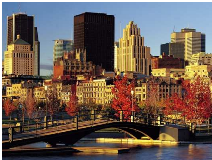
Fig. 1 : Le Vieux Port de Montréal a été inscrit sur la liste du patrimoine.

Nous venons d'évoquer certains objectifs fondamentaux ainsi que les mesures qui pourraient être intéressantes d'engager. Cependant, vu le caractère unique de chaque ville, des diversités et spécifiques locales, les besoins particuliers de la ville et surtout de ses habitants, ne devraient jamais être négligés.