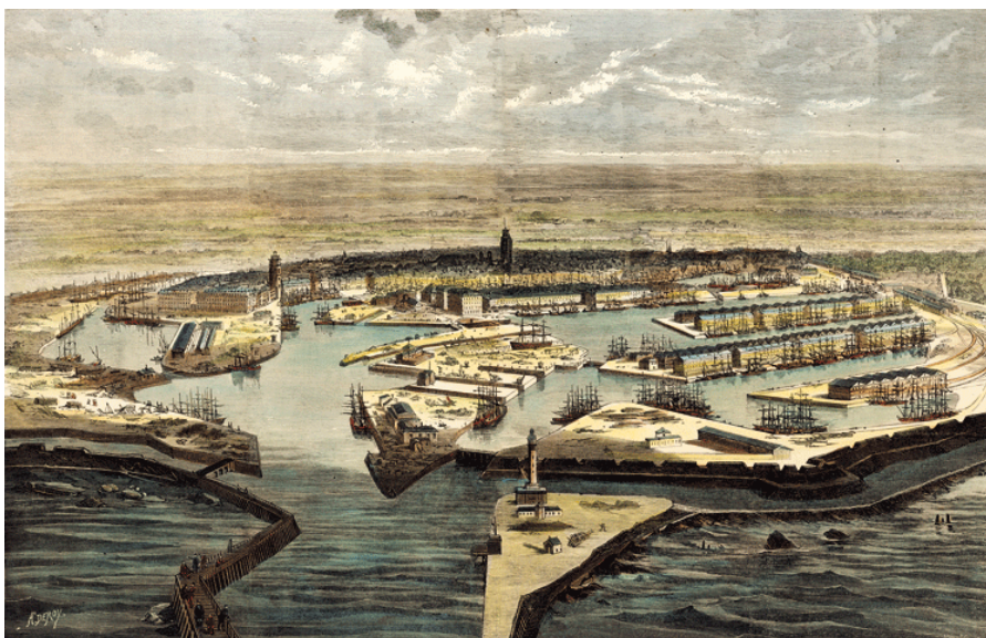
Fig. 3 : La ville portuaire de Dunkerque vers 1890.

Dès les années 800 jusqu'à 1700, le port de Dunkerque est l'élément constructeur de la ville. L'économie de cette ville est basée sur la pêche et le commerce et la majorité des habitants sont des pêcheurs. On parle de société portuaire.