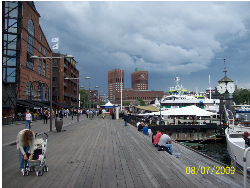
Fig. 2 : A Oslo, la recomposition du port a été accompagnée par la mise en place des lignes régulières de bateaux, intégrées aux réseaux du transport en commun.

Les cas de Rotterdam, Hambourg, Manchester, Barcelone, Buenos Aires, New York, Boston ou encore Baltimore portent également sur une recomposition urbaine de qualité.