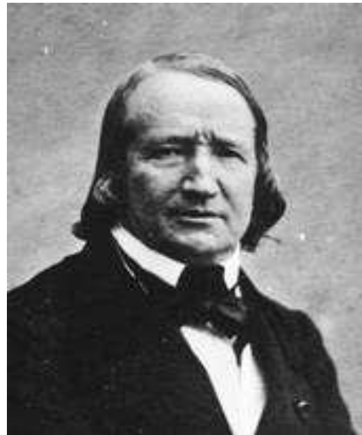
Alfred de Vigny (1797-1863)