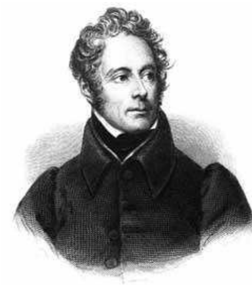
Alphonse de Lamartine (1790-1869)