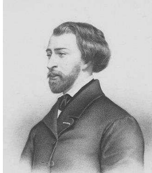
Alfred de Musset (1810-1857)