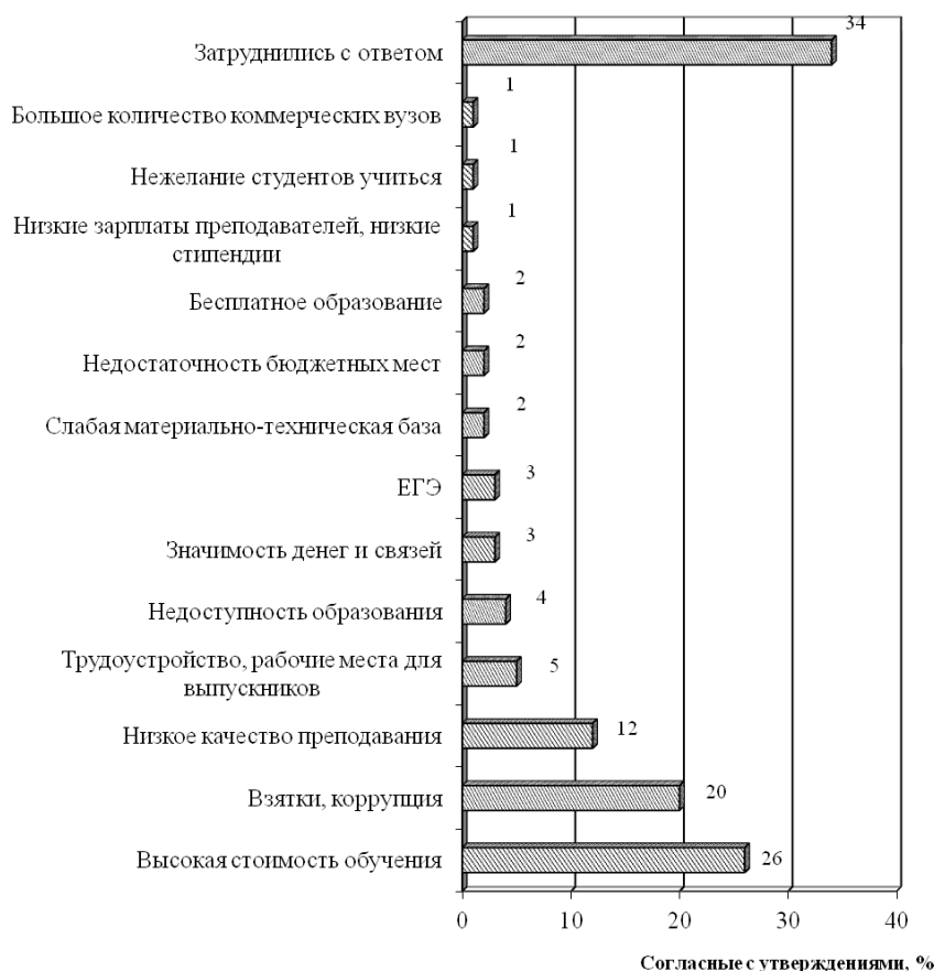
Рис. 4. Основные проблемы высшего образования в России, в %, 2011 г (диаграмма составлена автором на основе данных работы [9])

Во многом это определило высокий уровень коррупции. Взятки широко распространены как на этапе поступления в вузы, так и в процессе учебы. Такое положение дел в высшей школе влечет за собой не только моральные издержки, но и экономически дискредитирует диплом вуза, заставляя потенциального работодателя сомневаться в честности получения диплома. Снижается рыночная оценка вузовского диплома — разрыв среднего уровня зарплаты выпускников вузов и работников без высшего образования постепенно уменьшается. Это подтверждается и опросами среди населения. Так, 51 % опрошенных в рамках исследования ВЦИОМ согласны с утверждением, что «значимость высшего образования часто преувеличивают, в наше время и без него можно сделать удачную карьеру и устроить свою жизнь».