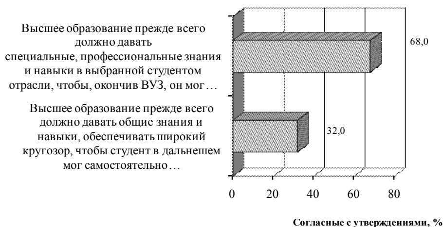
Рис. 1. Распределение населения относительно подходов прагматизации и гуманитаризации (диаграмма составлена автором на основе данных работы [9])

Как показывают исследования, у более образованных людей больше шансов найти работу и, если они экономически активны, меньше шансов остаться безработным. Однако помимо образования для благополучия человека необходимы такие факторы, как обладание правами человека и гражданскими свободами, хорошее состояние здоровья, чистая окружающая среда и личная безопасность.