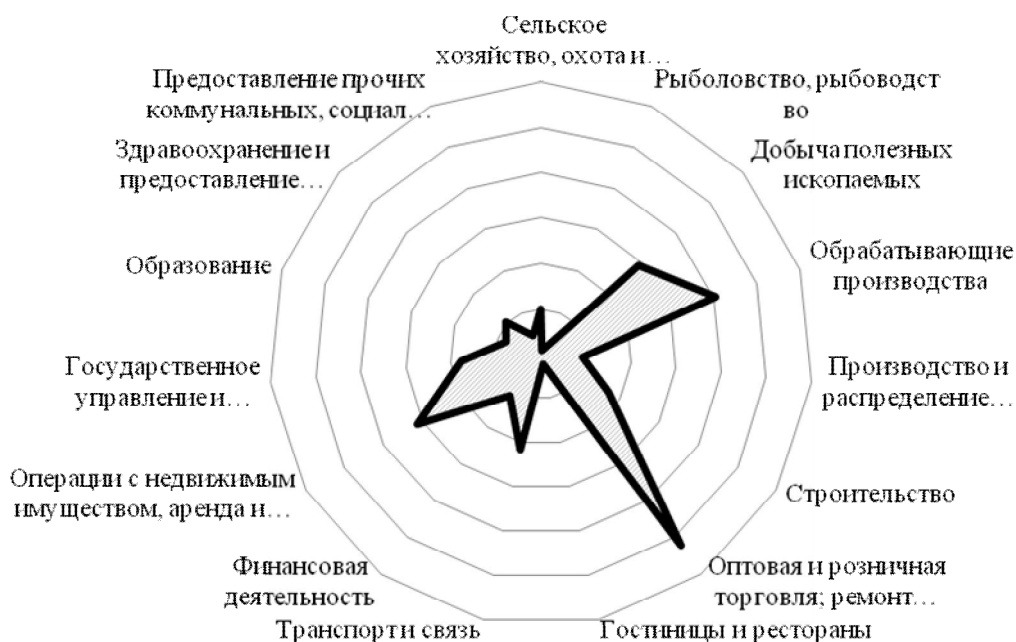
Диаграмма рассчитана и составлена автором на основе данных: Национальные счета: валовой внутренний продукт // Официальный сайт Федеральной службы государственной статистики. – URL: http://www.gks.ru/free_doc/new_site/vvp/

В последнее десятилетие характер развития составляющих индустриальный сектор экономики частей был неравномерным (график на рисунке 2). В целом по экономике в период с 2002 по 2012 годы темп роста объема ВДС составил 151,6%. Аналогичный темп роста был отмечен и в целом по сектору промышленности – 163,0% (где объем производства ВДС увеличился с 2,6 трлн. руб. до 15,7 трлн. руб., в основных рыночных ценах).