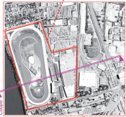
Implantation du complexe entre le Canal du nord et le Pôle multimodal du sud (100 Murs x 100 Murs)