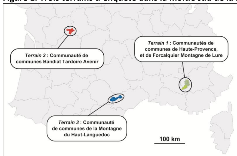
Figure 1. Trois terrains d'enquête dans la moitié sud de la France

A travers ces trois études de territoires, il s'agissait d'exemplifier différents processus et tendances observés à l'échelle nationale, et d'approfondir l'analyse des formes de renouveau démographique constatées dans les campagnes françaises. La confrontation des discours recueillis, pour chacun des trois terrains et entre cas d'étude, a notamment permis de dégager plusieurs motivations récurrentes, non exhaustives et non exclusives, d'installation des nouveaux arrivants. L'attractivité croissante de nombreux territoires ruraux étant sans conteste le principal facteur explicatif de leurs reprises démographiques, il est d'autant plus important de s'intéresser aux ressorts et comportements individuels qui en sont à l'origine.