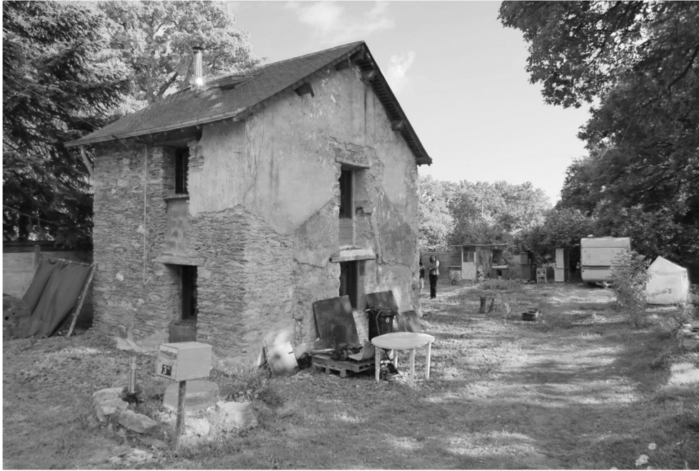
Figure 2. Maison habitée en cours d'auto-réhabilitation. Bien que constituant un critère d'achat pour la maison, le terrain arboré s'est finalement révélé trop occultant pour l'ensoleillement de la pièce de vie au rez-de-chaussée.

Au-delà de l'expérience du chez-soi, les habitants font appel dans leur discours à des situations vécues, plus ou moins récentes, qui justifient également les choix pris ou les futurs aménagements envisagés. En effet, les envies qui portent les projets s'appuient sur des observations remobilisées par les habitants pour prendre des décisions par transposition, même si on peut s'interroger parfois sur la pertinence des comparaisons, négligeant dans certains cas l'impact des modes constructifs ou du climat :