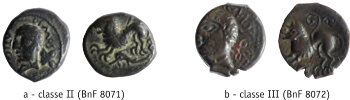
Figure 6 - Monnaies à légende ATISIOS REMOS (SST 147)

On a ainsi cherché une influence romaine dans l'iconographie des monnaies lexoviennes à l'aigle et à la fleur où P.-M. Guihard voit une référence à l'âge d'Or augustéen, ce qui suppose une frappe postérieure à 17 av. J.-C., à mon sens trop tardive 11 . Au contraire, les monnaies au portrait de CISIAMBOS ont un prototype bien gaulois, à savoir les monnaies d'ATISIOS REMOS (SST 147), dont la frappe doit probablement être placée vers 50/40 av. J.-C. : sur les classes II et III, même tête imberbe à gauche et surtout même fleur à quatre pétales derrière la tête (figure 6). Le lion du revers rappelle également celui de la classe I des grands bronzes éburovices, mais il s'agit également d'un motif un peu plus répandu. On note aussi, sur certains exemplaires de la classe II des ATISIOS REMOS et sur les bronzes à légende ATESOS et KRACCVS (SST 148 et 149), également attribués aux Rèmes, une coiffure similaire à celle du bronze éburovice de classe I. Le lien entre les monnaies normandes et les ATISIOS REMOS est d'autant plus intéressant qu'on en connaît un ex. à Neufchâtel-en-Brie (Seine-Maritime), alors que la distribution du type est concentrée en Gaule Belgique centrale et orientale 12 .