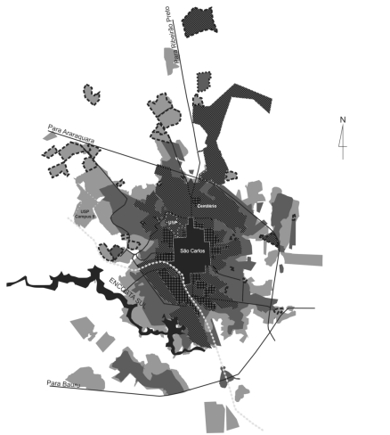
Carte 4. Presidente Prudente