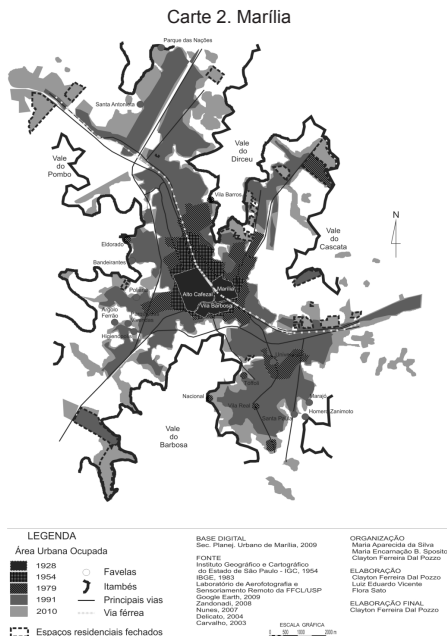
Cartes 2, 3, 4. Croissance et dispersion urbaines

Pour Dematteis (1998), la déconcentration urbaine peut être envisagée comme un phénomène structurel qui opère à deux échelles. La première s'inscrit dans un rayon de plusieurs dizaines de kilomètres, où s'effectuent les mobilités nécessaires à la réalisation de la vie quotidienne. Pour l'auteur, quand on observe une diminution relative de la population dans la zone centrale et un accroissement important dans les centres les plus petits, on est face à une redistribution géographique de la population dans une zone urbaine.