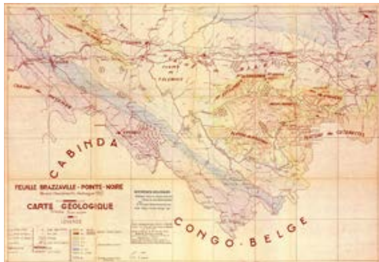
FIGURE 5 / Carte géologique à 1/200 000, feuille Brazzaville - Pointe Noire, République du Congo (Babet et Chochine, 1952).

open source de type CeciLL) ni dépendance à l'égard d'éditeurs de solutions logicielles, l'automatisation des fonctions d'une bibliothèque, répondant ainsi aux besoins de gestion et de diffusion, papier ou numérique, des professionnels de la documentation.