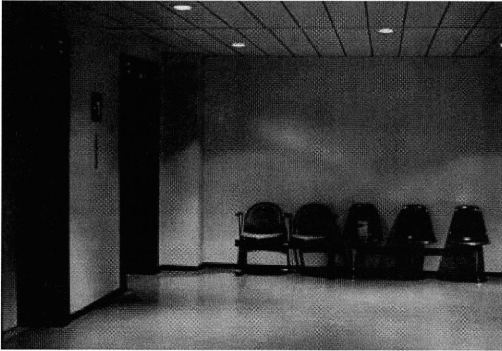
Hall des ascenseurs