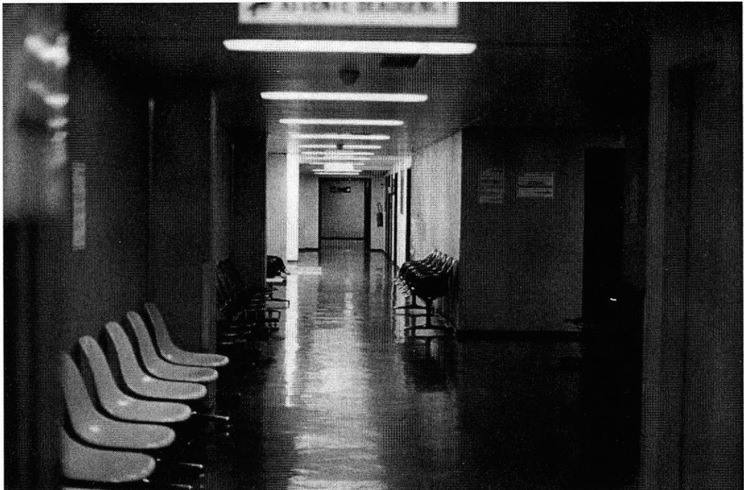
Couloir de l'attente Beaugency