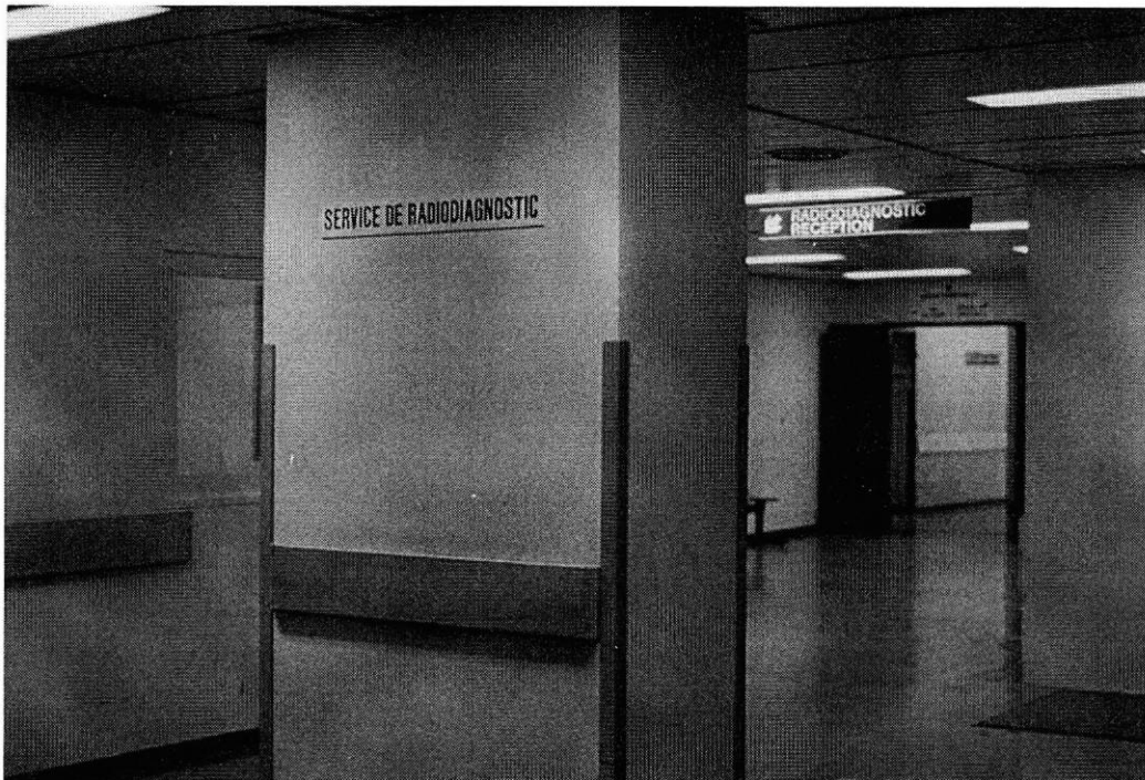
Espace d'accueil depuis la sortie du hall des ascenseurs