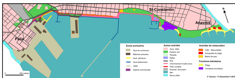
Figure 1 : Cartographie générale de la façade maritime de Volos

Pour tenter d'apporter des éléments de réponse, nous avons opté pour un double parti-pris : entrer par la notion d'atmosphère et adopter une méthode ethnographique. Le terrain choisi est la façade maritime de la ville de Volos qui, de la rivière Alamanas (à l'Ouest) au cours d'eau Anavris (à l'Est), représente un ensemble urbain long de deux kilomètres qui a la particularité de disposer d'une succession quasi ininterrompue d'établissements de débit de boisson et de restauration. Le travail de terrain a consisté à opérer des relevés – selon un cheminement inchangé - à différentes heures du jour, à dresser un état des lieux systématique (à partir de prises de notes et photographies) dans le souci de retranscrire ces données de manière cartographique.