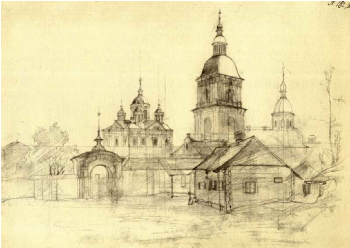
Fig. 6. Le monastère de la Transfiguration du Saint Sauveur de Mežyhirja. Dessin au crayon à mine graffite. 1843.

L'œuvre picturale, graphique et littéraire de T. Ševčenko s'est nourri de thème de l'histoire de la cosaquerie 20 . La contribution de T. Ševčenko-peintre dans la création des ressources iconographiques, qui mettent en valeur le patrimoine architectural ukrainien de la période d'épanouissement de la culture ukrainienne, est très significative et symbolique. L'artiste fut peut-être un des premiers à comprendre et à apprécier profondément l'importance de ces monuments et de voir dans leur diversité une certaine unité, une empreinte commune, c'est-à-dire une tradition architecturale ukrainienne, capable à affirmer l'identité culturelle de la nation.