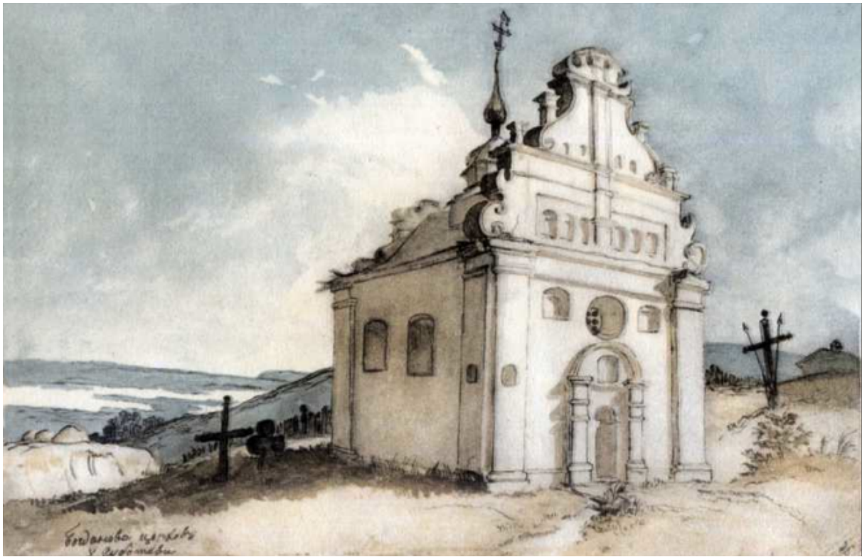
Fig. 5. L'église de Bohdan à Subotiv. Dessin rehaussé à l'aquarelle. 1845.

Dans son poème Les Hajdamaks on assiste à la prise de conscience de T. Ševčenko de l'ampleur de désastre qui s'est abattu sur l'Ukraine depuis la perte progressive de son indépendance. Il exprime sa tristesse et son émotion douloureuse à la vue des restes de l'ancienne capitale des hetmans ukrainiens, Čyhyryn :