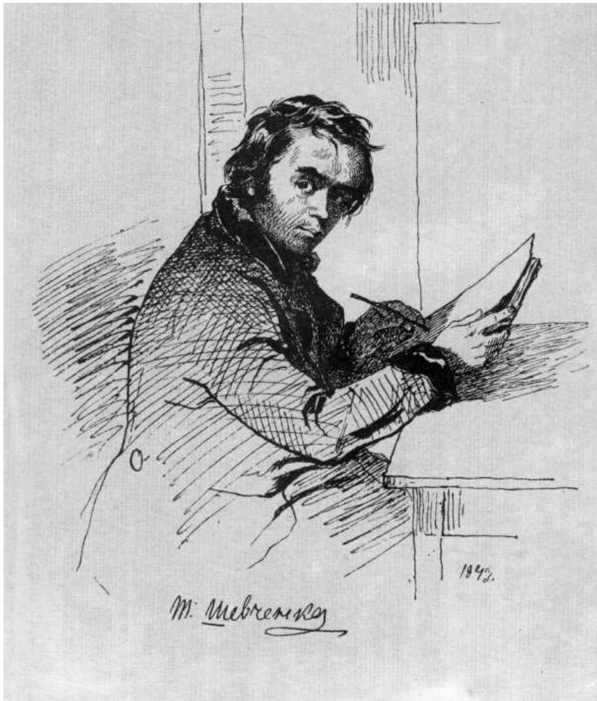
Fig. 1. Autoportrait de T. Ševčenko qui date de son premier voyage en Ukraine de 1843.

L'artiste s'attache à fixer sur le papier les glorieux sites historiques, les silhouettes inimitables des monastères et des églises, les ruines romantiques des châteaux, les petites chapelles abandonnées, les maisons paysannes aux murs blanchis à la chaux recouvertes de chaume.