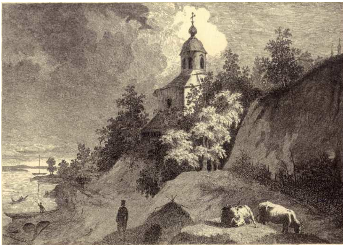
Fig.2. La vue du Monastère Vydbetsky à Kiev. Eau forte. 1844.

réparent et font sécher les filets de pêche et un groupe de moines traverse le Dniepr sur de petites barques rudimentaires.