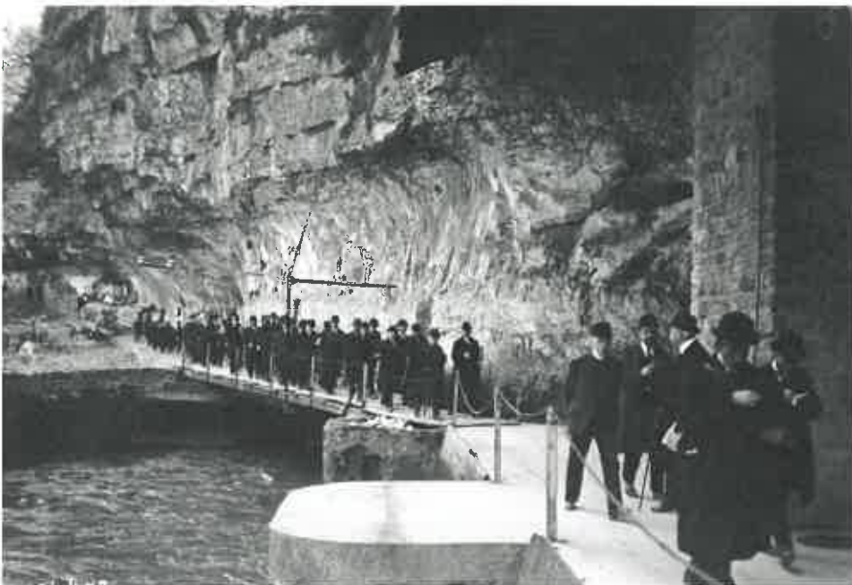
Le président Millerand arrivant à l'usine hydro électrique de Bellegarde (1927) [photographie de presse]

Dans le même temps cependant, l'électrification était loin d'être achevée. Au lendemain de la Première Guerre mondiale, seules 20% des communes françaises avaient accès à l'électricité, souvent sur une partie de leur territoire seulement 4 . L'électrification rurale constituait alors un enjeu majeur, avec en arrière-plan l'idée que la nation avait contracté une dette à l'égard des campagnes, dont une partie des habitants avait été sacrifiée sur l'autel de la victoire. Il s'agissait donc de mobiliser la puissance publique pour cet effort d'équipement. Dans ce contexte, de nombreux Conseils généraux allaient intervenir de leur propre initiative pour épauler l'État et les communes.