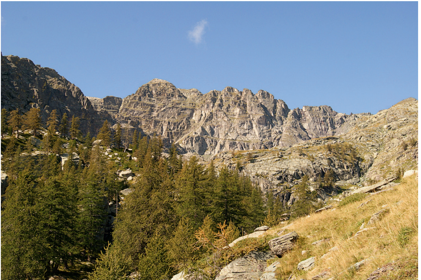
Fig. 1. Vue du mont Bego depuis le groupe IV de la zone XIX du val de Fontanalba.