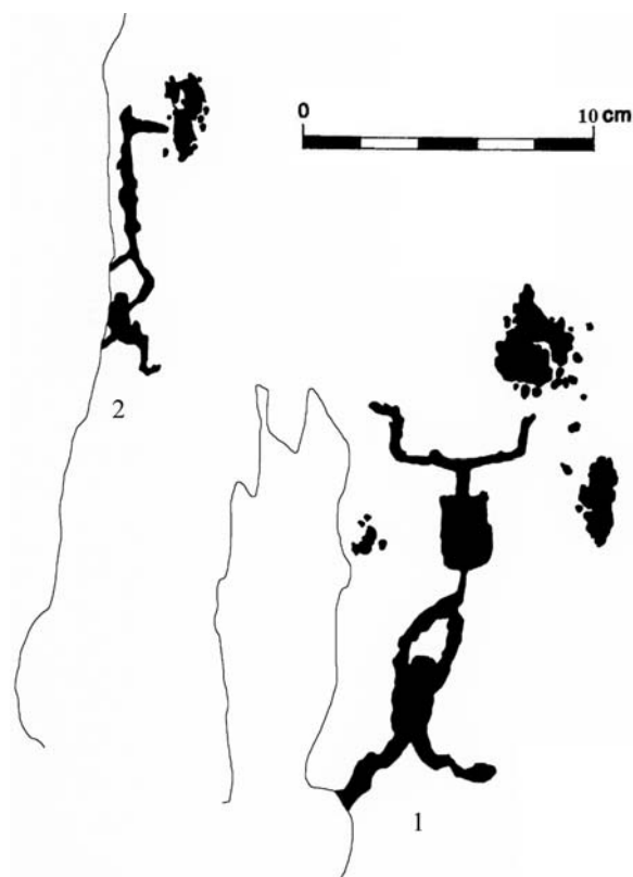
Fig. 2. Anthropomorphes gravés interagissant avec un corniforme (1) (ZXVII.GI.R14 \alpha -35) et brandissant une hallebarde (2) (ZXVII.GI.R14 \alpha -29) dans le val de Fontanalba. (Relevés L. Roche & J. Masson Mourey ; © Laboratoire de Préhistoire de Nice-Côte d'Azur).

une hallebarde (fig. 2.2). La position chronologique des anthropomorphes associés à ce type d'arme très particulier est établie au début de l'Âge du Bronze ancien, soit entre la fin du III e et le début du II e millénaires avant notre ère (Huet 2012). Les analogies stylistiques (réalisation par piquetage, faibles dimensions et posture dynamique) qui existent entre les anthropomorphes armés et le personnage interagissant avec un corniforme invitent à situer celui-ci à la même période.