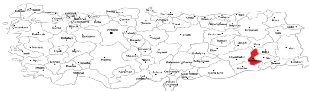
Figure 1: Les provinces de Turquie : En rouge, la province de Batman, où se situe notre terrain de recherche.

Les élèves qui manifestent un intérêt pour l'apprentissage du kurde se concentrent en majorité dans les provinces du sud-est de la Turquie où la population kurde est majoritaire. Ceci explique que le choix du terrain de cette étude se soit porté sur ces provinces. Nous avons fait le choix d'effectuer notre enquête dans deux contextes : urbain et rural. C'est la ville de Batman qui a été retenue pour l'enquête en milieu urbain. Pour ce qui est du contexte rural, le choix s'est porté sur un village 4 à une heure de distance de Batman. La zone en rouge sur la carte géographique ci-dessous indique la localisation de notre recherche de terrain :