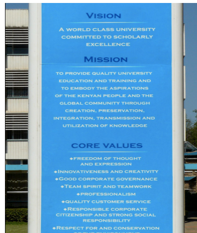
Photo 1. Les trois fétiches "Vision", "Mission" et "Core Values" placés à l'entrée du campus principal de l'université de Nairobi