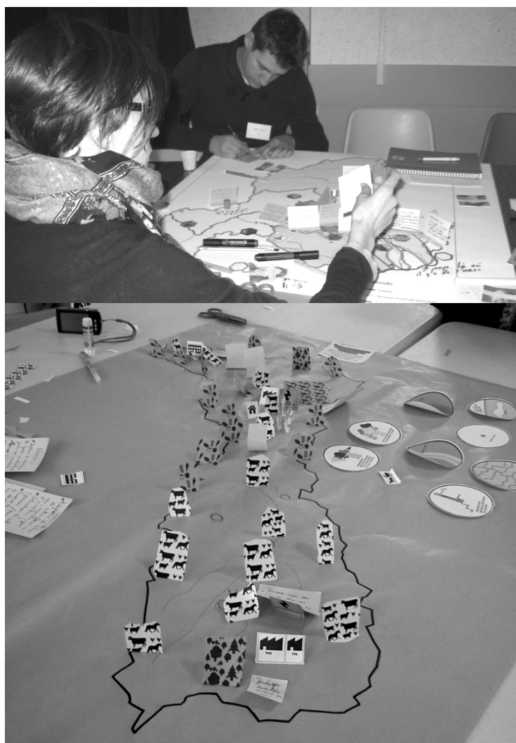
Figure 2 – Des participants à l'atelier du climat de la Tille ; Exemple de carte du territoire futur réalisée pour l'Armançon.

Pour la troisième étape, les designers ont eu recours à des photos, points de départ pour imaginer la même situation en 2043 et faire de ces photos des « cartes postales du futur ». La créativité des participants était alors sollicitée sur le mode analogique : quelles associations d'idées sont formulées, à l'évocation de ces situations éloignées dans le temps ? Le design a commencé à produire des éléments d'adaptation à partir de la quatrième étape, en deuxième séance. Sur l'Armançon, elle consistait à réaliser des cartes en relief par la matérialisation d'activités économiques, sociales et des infrastructures, symbolisées par des pictogrammes qu'il fallait découper et coller sur la carte (cf. Fig. 2). Cette approche kinesthésique du territoire était aussi une façon de libérer la créativité des participants. Selon les designers 6 , le dessin rend explicite le dessein. En se mettant en mouvement pour modéliser une carte, les participants étaient placés dans un rôle actif pour construire le futur. La participation reposait sur un savoir et un faire combinés, rendant effective la participation (Borzeix et al. , 2015).