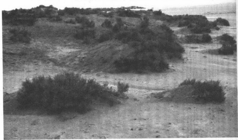
FIG. 20.7 – La sebkhet er Riana, banlieue nord-est de Tunis, Tunisie. Photo J.-L. Ballais (24 décembre 1987). En bordure (premier plan) de la sebkha (deuxième plan), des pseudo-sables gypseux piégés par la végétation halophyte édifient une lunette.

développés. Ces lunettes australiennes ont commencé à se former vers 36 000 ans avant l'actuel, à la fin d'une longue phase lacustre et ont cessé de se former il y a 17 000 ans, quand le climat devint légèrement plus humide de nouveau (Bowler, 1983). En Afrique du Nord, si de nombreuses lunettes sont fossiles (Coque, 1979), celles de l'étage semi-aride en Tunisie — par exemple sur le bord sud-est des sebkhas er Riana et Sedjoumi près de Tunis — et en Algérie celle de la Garaet et Tarf 1 (Benazzouz, 1986) sont encore fonctionnelles, parfois avec des vitesses d'accumulation réduites.