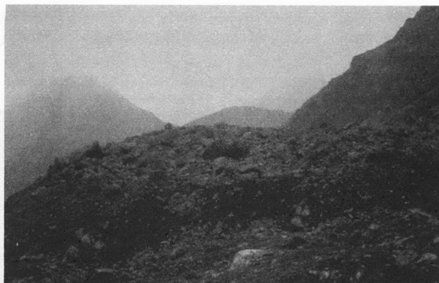
FIG. 20.2 – Glacier rocheux actuel dans le massif du Chambeyron (Alpes du Sud, France). Bourrelet terminal et front vus de profil (été 1979).