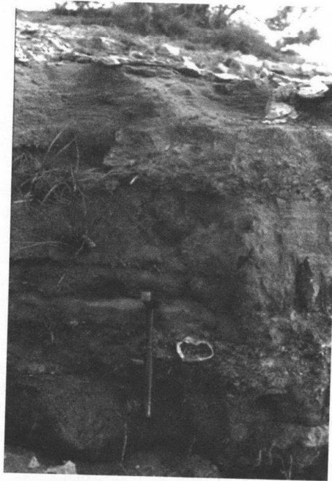
FIG. 20.6 – Coupe du lit majeur de l'oued Ouerra vers Aïn Aïcha (Prérief, Maroc). Photo J.-L. Ballais (mai 1998). Dans un niveau sableux, à côté du marteau, un fragment de bouteille d'huile en plastique.

se poursuit. Commencée souvent pendant l'Antiquité ou avant sur l'Aigue, l'Ouvèze, l'oued Medjerda, l'oued Biskra, elle s'est poursuivie au XX e siècle, au moins sur certains d'entre eux (Bonté et al. , 2001). Dans ces conditions, l'envahissement des lits majeurs par de nombreuses habitations depuis quelques dizaines d'années pose un problème majeur de sécurité.