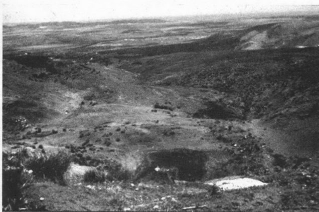
FIG. 20.3 – Glissement sur le versant du djebel Zaghouan (dorsale tunisienne). Orienté au nord-est, il affecte des marnes ; il est encadré par deux talwegs et une mare occupe le pied de la niche sommitale (printemps 1987).

ces processus au nord de la Méditerranée, tout particulièrement en Italie et dans les Alpes françaises (Sorriso-Valvo et al. , 1993 ; Dumas et al. , 1993 ; Julian et Anthony, 1993 ; Malet et al. , 2002).