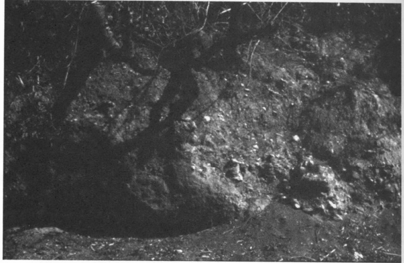
FIG. 20.4 – Colluvions à Fès (Maroc). Photo J.-L. Ballais (octobre 1994). Épaisseurs localement de 2 m, elles sont postérieures à la création de la ville, au VIII e s. ap. J.-C.

millénaires dans le bassin méditerranéen (figure 20.4), quelques siècles (USA, Afrique du Sud) ou moins de 200 ans (Australie) — qui a favorisé, voire créé les conditions d'un colluvionnement massif.