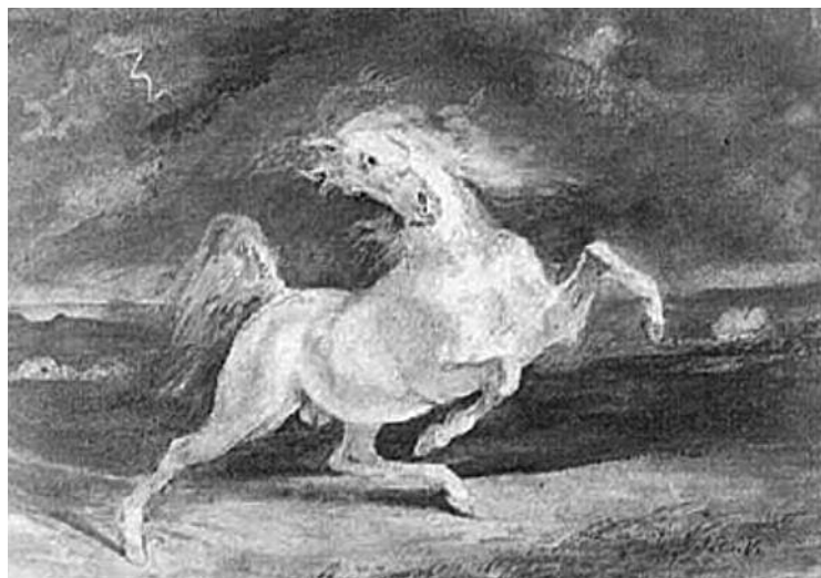
Illustration 3 • Cheval effrayé par l’orage • Delacroix, 1824

Ainsi, le cheval, “ idéogramme de l’énergie ” (Clay, 1980, p. 150), inspire