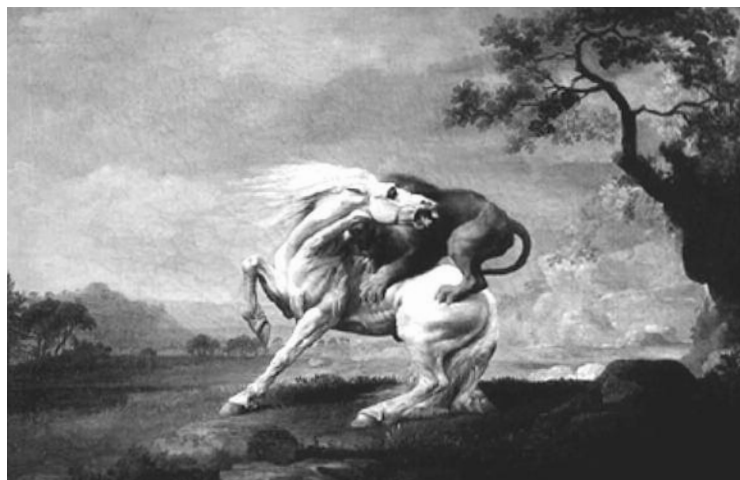
Illustration 2 • Cheval attaqué par un lion • Stubbs, 1765

des élites à la Renaissance, engendre une transformation de la structuration sociétale en construisant la " citadinisation " (Lévy et Lussault, 2003) de la population, qui sonne le glas de la relation vivrière à la terre. L'extranéité du rapport à l'environnement rural et à la nature se diffuse socialement (Pickel-Chevalier, 2014). Cette transformation induit aussi l'émergence d'un nouveau rapport au temps et à l'espace (Deprest, 1997). Les lieux mais aussi les moments de labeur et de vie familiale sont désormais strictement démarqués (Rybczynski, 1992 [édition originale 1991]), alors que l'on assiste à l'introduction d'une " discontinuité dans le temps unique " (Knafo et al., 1997), autrement dit : le temps vacant, qui deviendra vacances . Le tourisme se fait jour comme un système organisationnel, créant des lieux (stations), des usages et pratiques spécifiques dès le début du XIX e siècle. Le terme "touriste" appa-