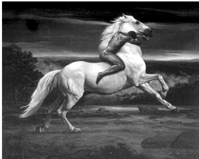
Illustration 7 • Fuga • Heriberto Cuadrado Cogollo, 1994

Au travers de l'œuvre des artistes contemporains, du XVIII e au XXI e siècle, le cheval est donc bien l'allégorie de l'homme sublimé dans sa force physique et ses tumultes ombrageux, seulement apaisés par l'amour et la douceur féminine... Loin d'être révolutionnaire, cette lecture est en directe filiation des maîtres du romantisme. Ainsi, Heriberto Cuadrado Cogollo confie : “Le cheval et la femme incarnent pour moi la sensualité ; la sensualité des corps robustes associant force et douceur. Je suis inspiré depuis ma jeunesse par les peintres du XIX e siècle