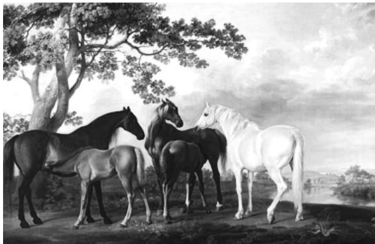
Illustration 1 • Juments et poulains dans un paysage de rivière • Stubbs, 1768

Aussi, au XVIII e siècle, le mouvement des Lumières conteste-t-il la société tripartite héritière d'un système féodal déchu (Caratini, 1983). Témoin impuissant de l'effondrement d'un monde fondé sur ses privilèges, la jeunesse aristocratique désœuvrée est en proie à la "dysharmonie de l'âme et du corps", appelée encore spleen ou mélancolie , qui s'apparente à la déprime (Corbin, 1988). Or, la mode artistique picturale répond à cette détresse, en se consacrant à l'immortalisation des symboles de la noblesse comme pour prévenir, en les fixant sur une toile, leur désuétude. À l'instar de la photographie un siècle plus tard, la peinture, en particulier anglaise, se fait d'une précision "topographique" (Meyer, 1992). Elle a pour dessein de suspendre le vol effréné du temps, en figeant les scènes qui glorifient le quotidien de l'aristocratie saisi dans son éclat, certes édulcoré par l'artiste. Dans ce contexte sont privilégiés les représentations de domaines et des grandes familles (Paul Sandby, Thomas Gainsborough, Richard Wilson), les marines, célébrant la domination anglaise des mers (Robert Cleveley, Charles Brooking, Francis Swaine, Thomas Whitcombe), mais aussi le cheval. Ce dernier est intrinsèquement associé à la vie mondaine, sous les pinceaux de John Wootton (La Chasse du duc de Beaufort, 1744) et surtout de George Stubbs. Surnommé "le peintre des chevaux" en raison d'une dextérité jusqu'alors inégalée dans leurs représentations