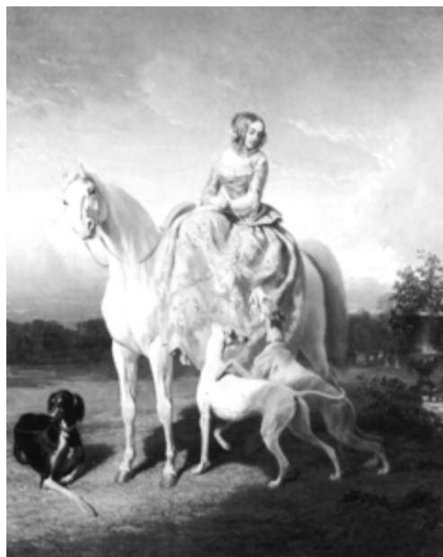
Illustration 8 • Amazone, cheval, chiens Alfred De Dreux (1810-1860)