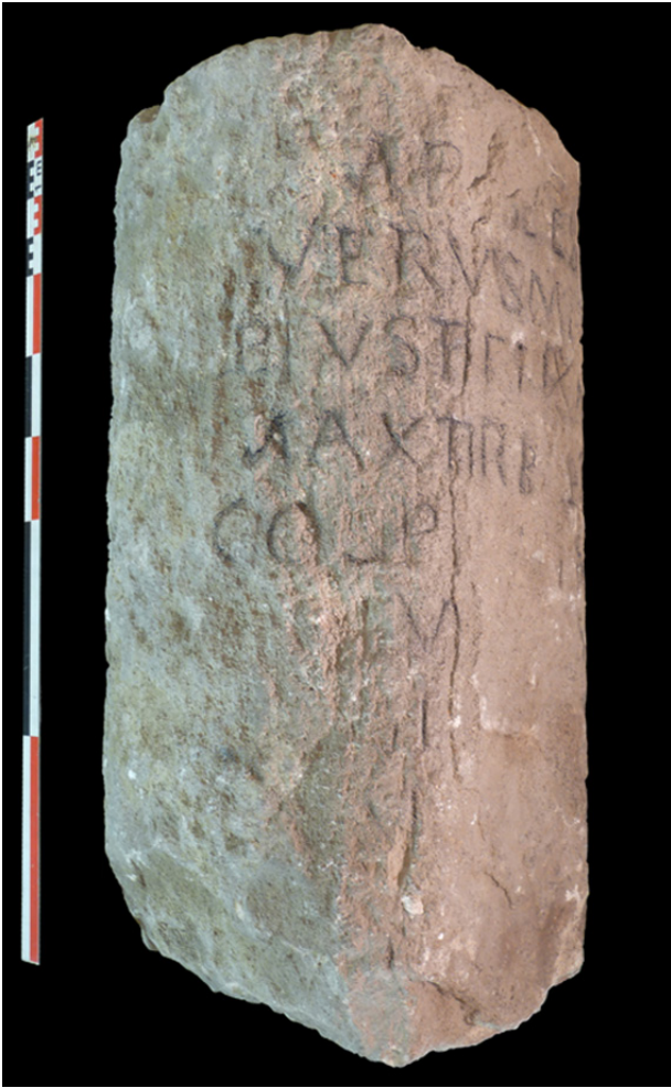
Fig. 2 : Borne milliaire de Chaspuzac.

et la mention du père et du fils ( CIL , XVII/2, 315, 317).