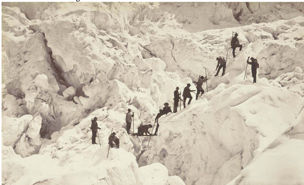
Fig. 6. L. et A. Bisson, « Passage à l'échelle horizontale. Ascension du Mont-Blanc », tirage sur papier albuminé d'après un négatif sur verre au collodion humide, 23 x 38,1 cm, 1862, coll. SFP.

« Nous avons essayé, dans ce rapide examen, de rendre l'impression produite par l'œuvre de MM. Bisson, qui serait digne d'illustrer le Cosmos de Humboldt ou quelque traité de géologie. Pour terminer, nous ne pouvons que remercier les courageux photographes d'avoir fourni à la science et à l'art de nouveaux éléments et de nouvelles images 16 . »