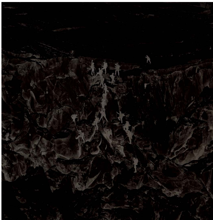
Fig. 1. L. et A. Bisson, « Savoie 19. À la rencontre des glaciers des Bossons et du Taconnaz (ascension manquée du Mont-Blanc) », détail, tirage sur papier albuminé d'après un négatif sur verre au collodion humide, 23,2 x 38,6 cm, coll. SFP.