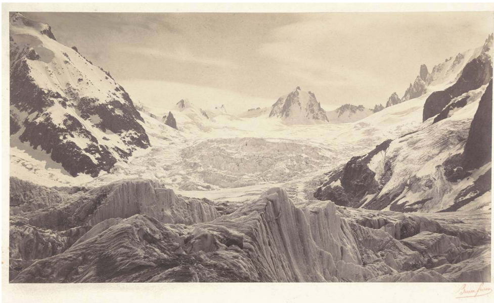
Fig. 8. L. et A. Bisson, « Séracs du géant. Chemin du jardin », tirage sur papier albuminé d'après un négatif sur verre au collodion humide, 23,2 x 39,8 cm, 1860, coll. SFP.

plutôt qu'à la relation, à la matérialité contingente de ce qui est plutôt qu'à la spiritualité harmonisée de ce qui devrait être.