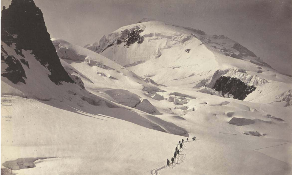
Fig. 4. L. et A. Bisson, « Savoie 35. Ascension du Mont-Blanc. Départ des grands Mulets », tirage sur papier albuminé d'après un négatif sur verre au collodion humide, 23,7 x 39,5 cm, 1862, coll. SFP.

cette mer immobile, plus accidentée et plus houleuse que l'Océan dans ses fureurs. On la voit se continuer par-delà le cadre de la planche sous son écume de neige. Cela donne tout à fait l'impression qu'on éprouve en observant la lune au télescope, lorsque l'ombre tombant de ses montagnes en dessine les anfractuosités sur le fond d'argent de son disque ébauché à demi. »