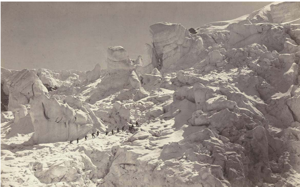
Fig. 5. L. et A. Bisson, « Savoie 41. Passage des échelles », tirage sur papier albuminé d'après un négatif sur verre au collodion humide, 24,6 x 40,3 cm, 1861, coll. SFP.