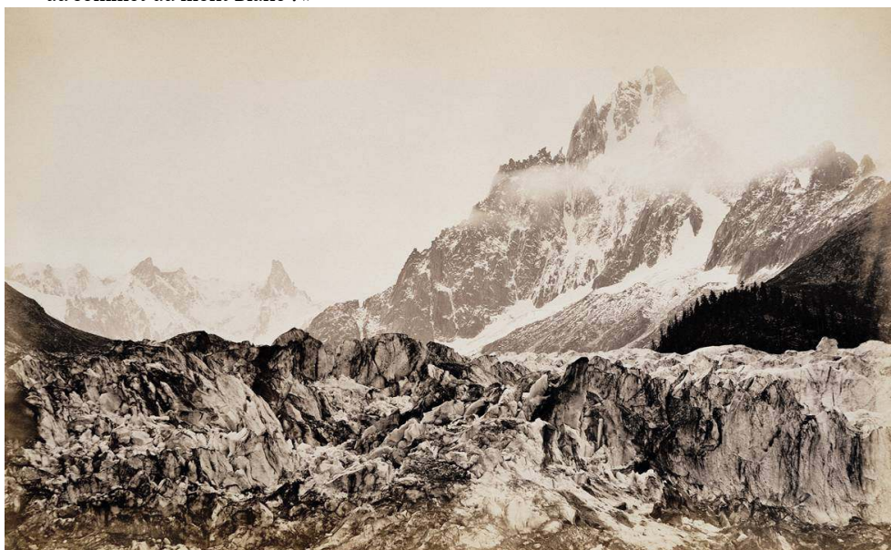
Fig. 2. L. et A. Bisson, « La mer de Glace et les Grands Charmoz », tirage sur papier albuminé d'après un négatif sur verre au collodion humide, 23,3 x 38 cm, v. 1860, coll. Sophie et Jérôme Seydoux.

du vide, le géant s'est affaissé sur lui-même ; une surface relativement plane s'étale au sommet du mont Blanc 7 . »