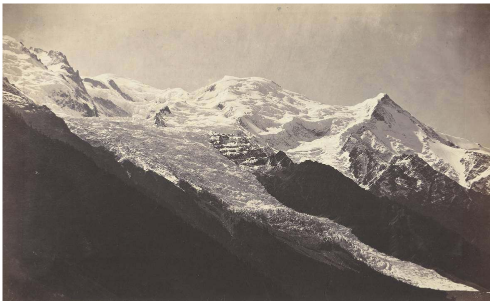
Fig. 3. L. et A. Bisson, « Savoie 2. Le Mont-Blanc et glacier des Bossons », tirage sur papier albuminé d'après un négatif sur verre au collodion humide, 27,5 x 44,3 cm, 1863, coll. SFP.