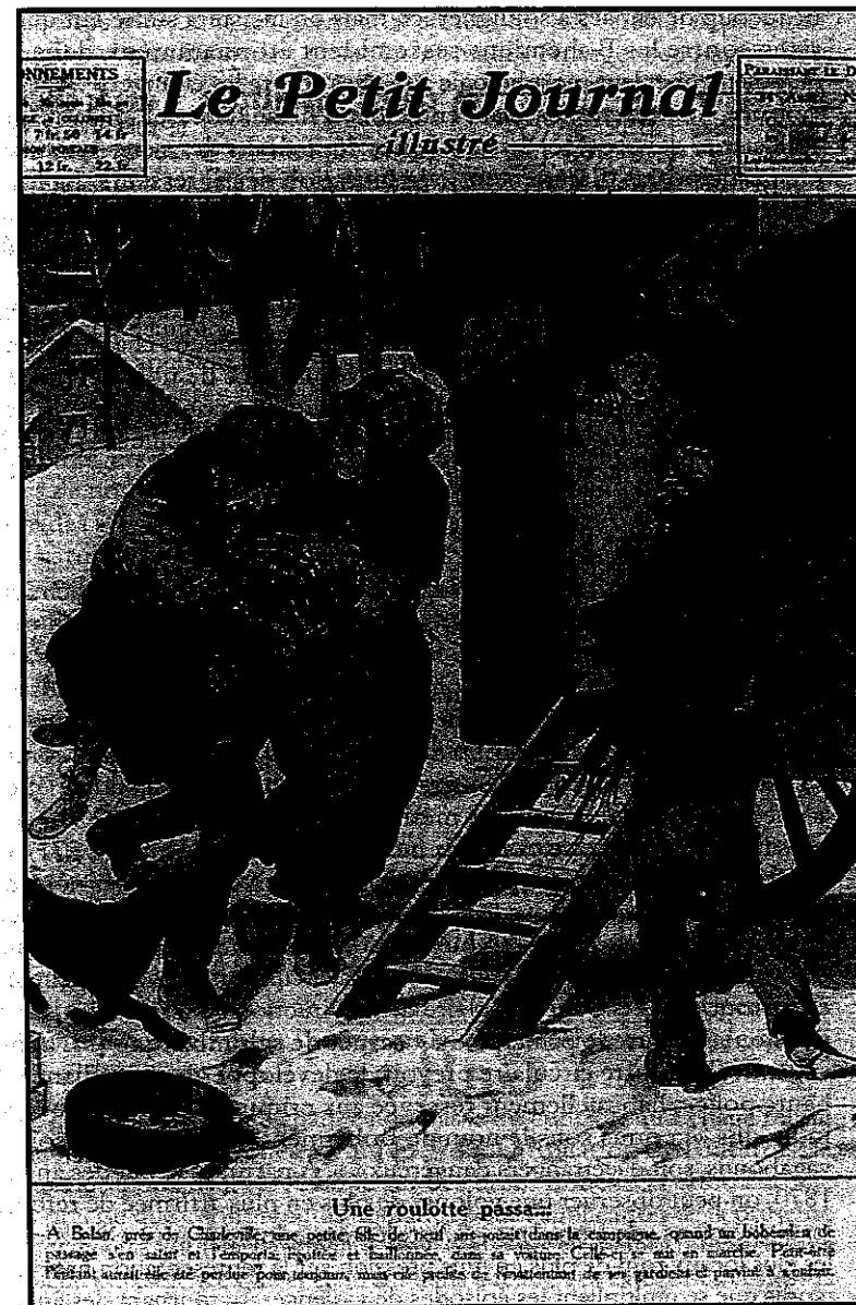
« Une roulotte passa... », Le Petit Journal , supplément illustré, 1923