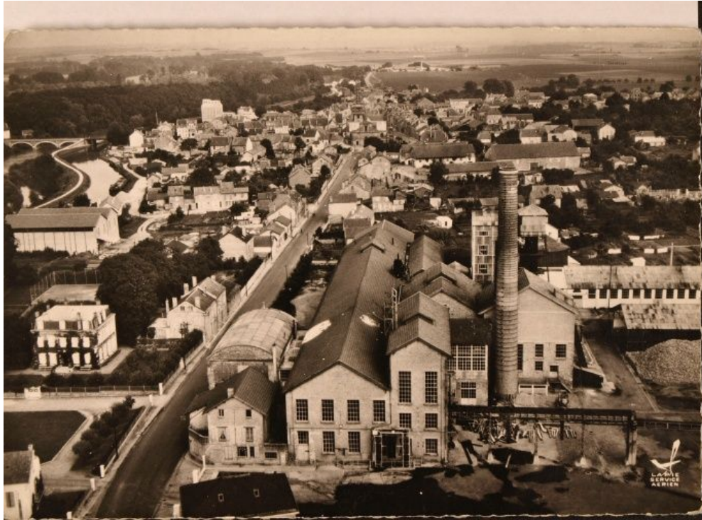
Annexe n°2 : 3 vues aériennes actuelles du site de la sucrerie.