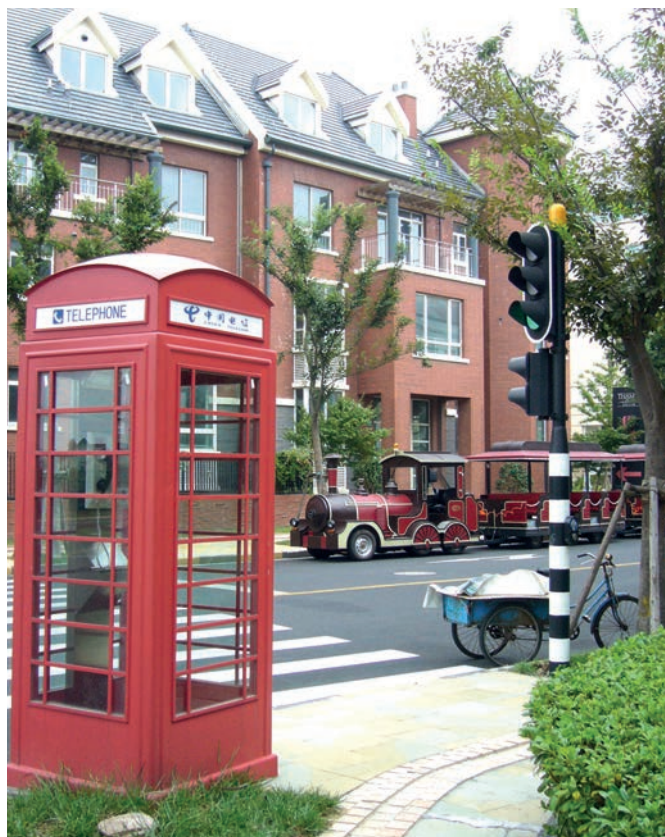
Photo 2 – Un cliché à l'anglaise en banlieue de Shanghai en août 2007.

Pour l'arrondissement de Songjiang et la société de développement de la ville nouvelle, Thames Town est un projet-vitrine visant à stimuler l'intérêt des promoteurs immobiliers et des particuliers, donc à maximiser la hausse de la valeur foncière lors de la cession des droits d'usage, ce qui correspond