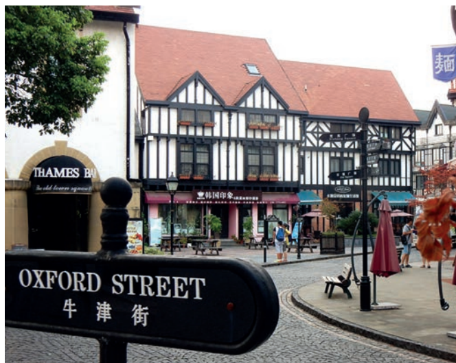
Photo 1 – Le centre « ancien » de Thames Town en août 2016.

Contrairement aux autres opérations du secteur à l'anglaise de Songjiang, comme British Manor, Red Villa, Shanghai Townhouse ou Rose Bush, lesquels présentent une homogénéité de leur bâti, le souci du détail est très poussé à Thames Town. La juxtaposition d'habitations relevant d'époques, de styles architecturaux, de compositions des volumes (fenêtre en saillie), de techniques de construction et de matériaux divers (colombages, briques rouges et grises, crépis) tend à faire naître une impression d'éclectisme. L'espace public de Thames Town se décline suivant trois ambiances : le cœur historique autour de l'église néo-gothique et de Love Square renvoie à un ensemble classique, géorgien et victorien ; Holiday Square, ceinturé de bâtiments en briques rouges et grises, symbolise la révolution industrielle