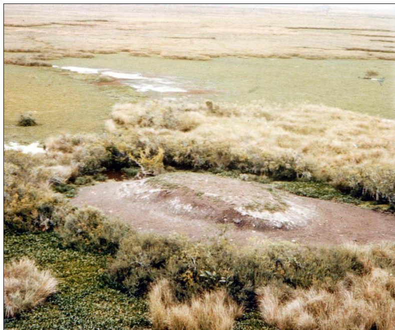
Figura 2 - Montículo antrópico de India Muerta, este de Uruguay

El conjunto de los montículos del norte y este de Uruguay, y del sur de Brasil, están (o estuvieron) asociados a extensas zonas inundables (Figura 3). Existen montículos que están vinculados por su génesis y por su distancia a las zonas inundables. Otros montículos están más distantes de las zonas inundables; por lo que la elección de su emplazamiento respondió a otras necesidades humanas.