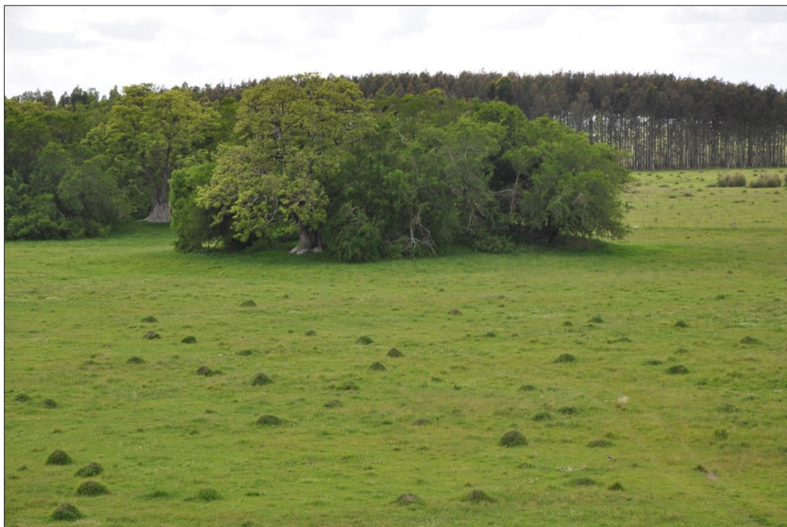
Figura 1 - Paisaje mixto de montículos, este de Uruguay: hormigueros al primer plano y montículo antrópico al fondo

Grandes proyectos interdisciplinarios han trabajado duro para demostrar que un paisaje de apariencia natural era de origen antrópico (ROSTAIN, 1991; LÓPEZ MAZZ, 1992; MCKEY et al. , 2010). Lo contrario también ha ocurrido, ya que estructuras consideradas como antrópicas resultaron ser de origen natural (MCKEY et al. , 2014; ROSTAIN et al. , 2014) Es con el desarrollo de excavaciones estratigráficas y sobretodo en área, en montículos, que se ha producido información nueva, específica y controlada; para discutir en profundidad los procesos de formación de los montículos (LÓPEZ MAZZ & BRACCO, 1994; MCKEY et al. , 2014; ROSTAIN & SAULIEU, 2014).