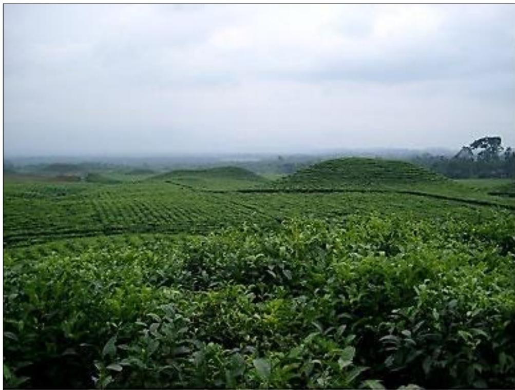
Figura 7 - Sitio Zulay, río Pastaza, Ecuador

Naturales o culturales, la identificación de montículos en las tierras bajas de Sudamérica no es un trabajo simple, cuando se trata de investigarlo. El proyecto “Arqueología de las tierras bajas de Sudamérica” (ECOS-Sud 2013-2014) no buscaba construir un inventario de los trabajos en tierra precolombinos y de las formaciones monticulares naturales, sino discernir las constantes de esas estructuras e intentar evaluar la parte de los actores en cada una de esas construcciones. Para hacer esto elaboramos una problemática común entre arqueólogos y ecólogos, y cada uno aportó respuestas desde sus metodologías propias.