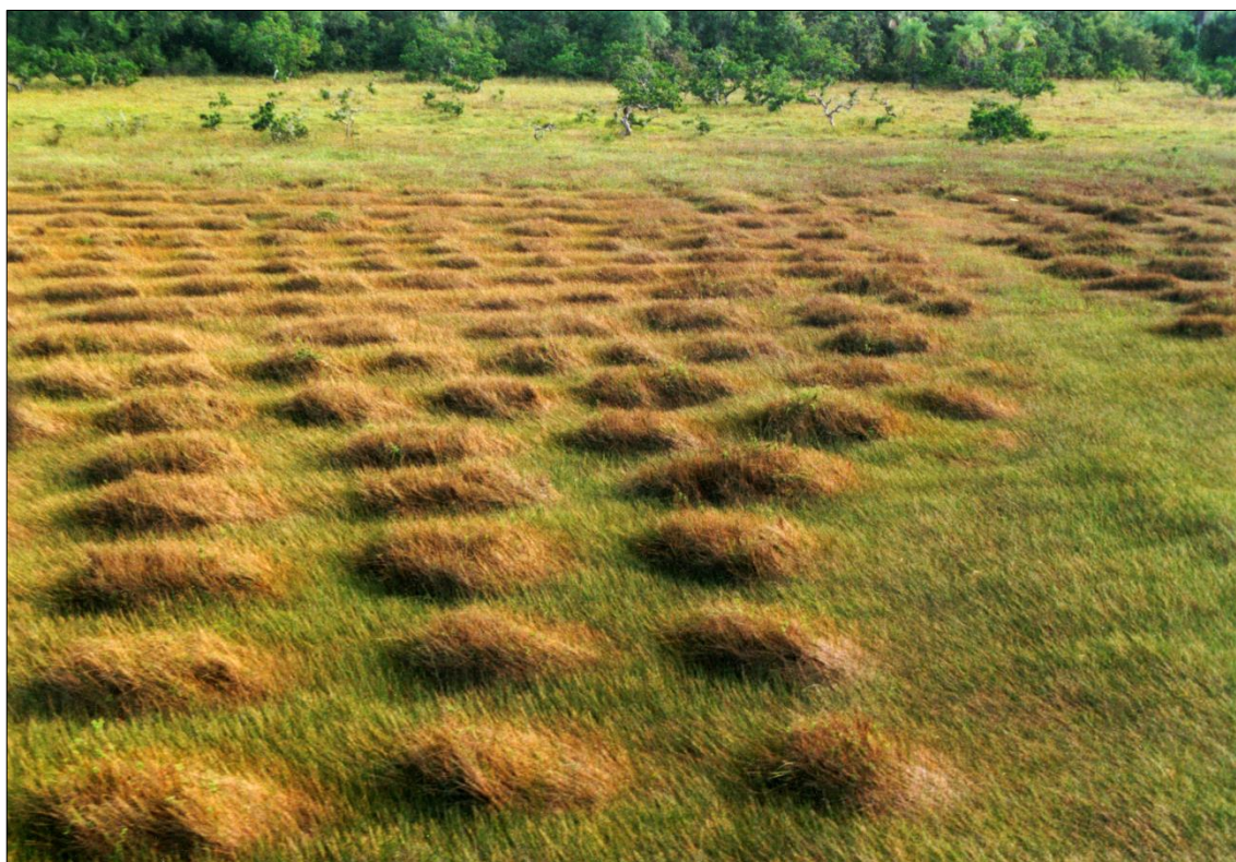
Figura 6 - Campos elevados del sitio Diamant, Guyana francesa (foto S. Rostain).

Entonces se trata de una agricultura monumental que fue elaborada por los habitantes precolombinos de las Guayanas. La importancia de estos movimientos de tierra es aún subestimado por algunos, que consideran que únicamente los colonizadores occidentales fueron inclinados a intentarlo, y capaces de efectuar, grandes transformaciones del paisaje. Mientras que el impacto de las comunidades indígenas precolombinas es de más en más