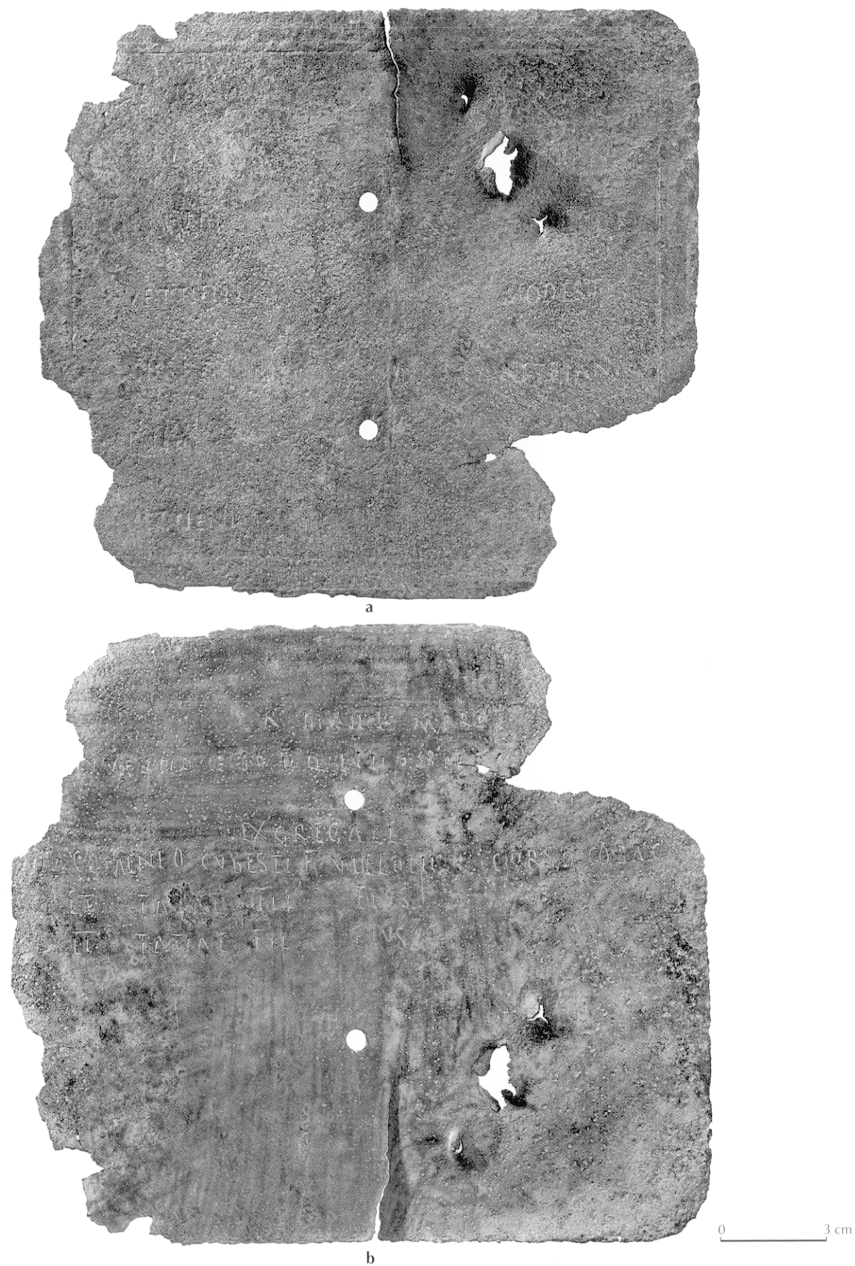
Fig. 2 – Diplôme militaire provenant d'Aléria (Haute-Corse), tabella II : a, extrinsecus ; b, intus (clichés M. Olive, Service régional de l'archéologie Provence-Alpes-Côte d'Azur).