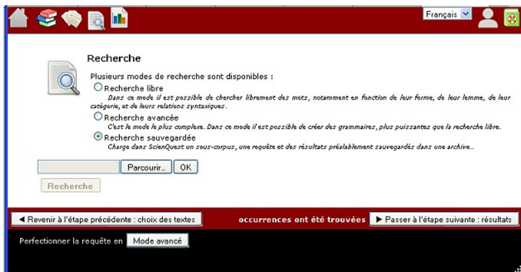
FIGURE 4 - Chargement d'une requête et ses résultats dans ScienQuest.