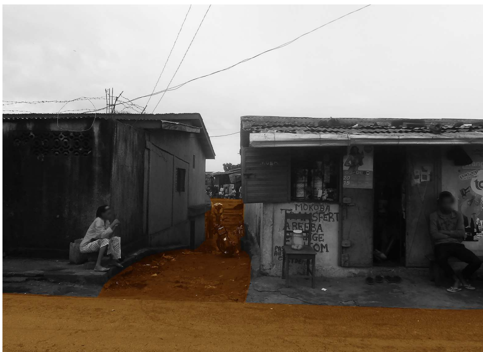
Photo 2. Un passage à Hafia