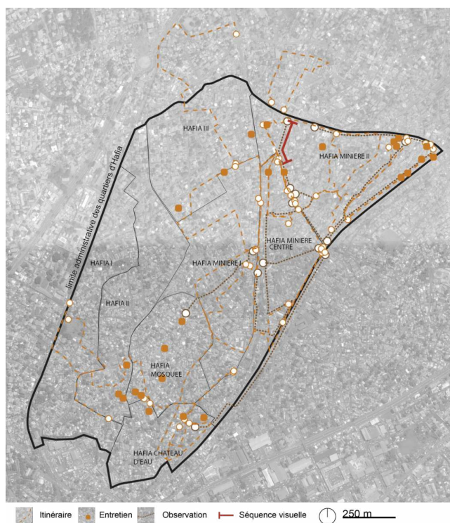
Carte 3. Représentation spatiale des enquêtes de terrain (2012-2015)