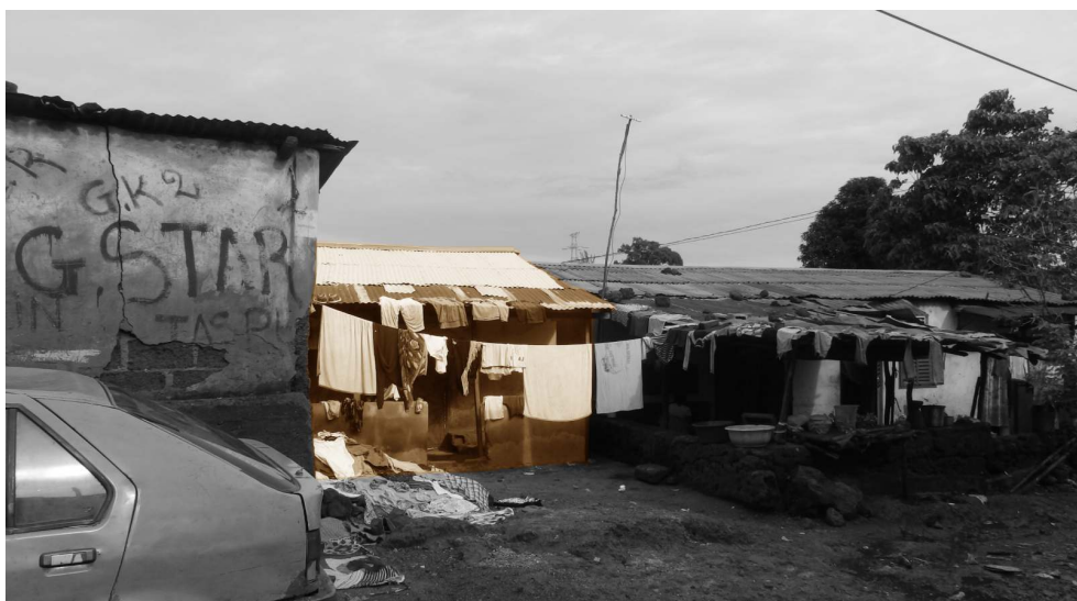
Photo 4. Fermeture des espaces à Hafïa