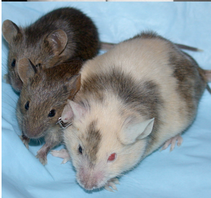
Béatrice Mintz, des souris issues de cellules du teratocarcinome.

Après bien des échecs à Paris et ailleurs et suite à un remarquable acharnement entretenu par la vive compétition entre ces laboratoires, Brinster et Mintz ont indépendamment obtenu d'abord des contributions somatiques puis Béatrice Mintz et Karl Illmensee une contribution à la lignée germinale [6]. Plus tard, combinée aux techniques de l'ingénierie génétique, une nouvelle manière de faire la génétique était inventée.